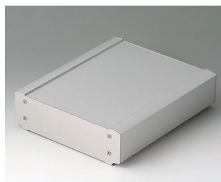
B3407023 SMART-TERMINAL 200 Aluminium AlMgSi 0,5 matt anodised 204x170x50mm