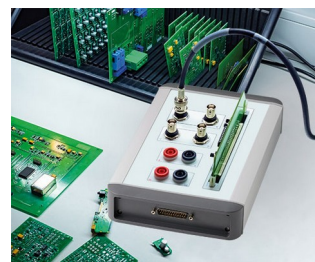
Testing of electronic components