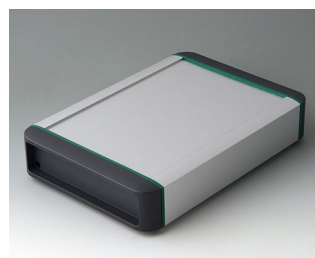
B3407021 SMART-TERMINAL 200 Aluminium AlMgSi 0,5 matt anodised 242x170x50mm IP 54