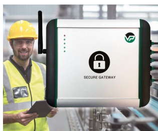
Industrial Secure Gateway