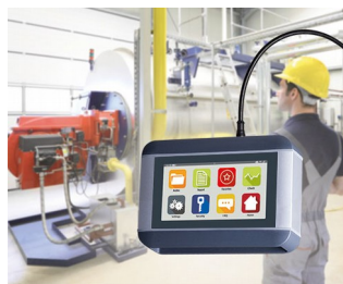
Mobile diagnostic device for machines and plants