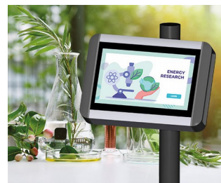
Plant research terminal