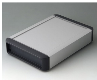
B3407022 SMART-TERMINAL 200 Aluminium AlMgSi 0,5 matt anodised 242x170x50mm IP 54