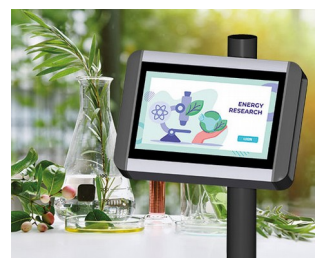
Plant research terminal