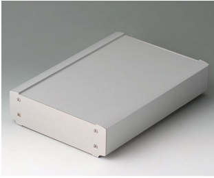
B3407033 SMART-TERMINAL 240 Aluminium AlMgSi 0,5 matt anodised 244x170x50mm