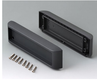
B3507011 Side covers set ASA+PC (UL 94 V-0) lava