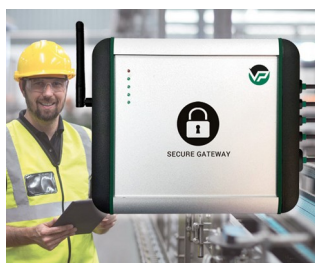
Industrial Secure Gateway