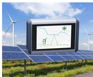
Smart meter for wind power and solar systems