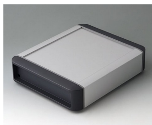
B3407012 SMART-TERMINAL 160 Aluminium AlMgSi 0,5 matt anodised 202x170x50mm IP 54