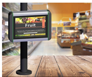
Information terminal at the point of sale