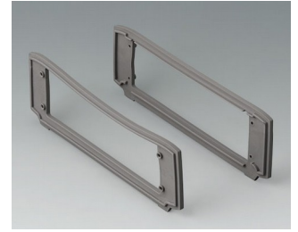
B3507017 Designer seals set, volcano TPV 50A volcano