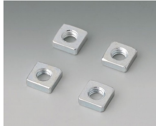
B3500001 Set of M3 square-head nuts Steel