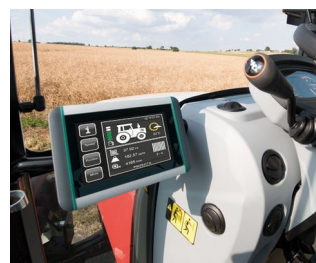
ISOBUS terminal for tractors and self-propelled machines