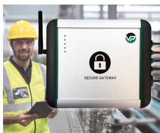
Industrial Secure Gateway