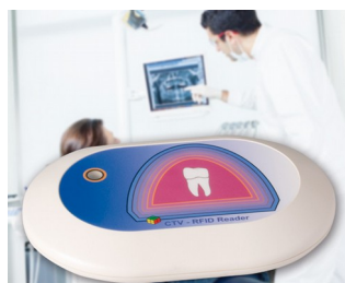
RFID Reader for the CTV system