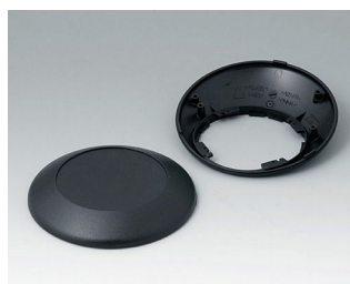
B5010209 Bottom and top part R110 F ABS (UL 94 HB) black RAL 9005 ø110x38mm