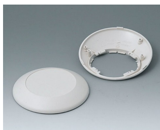
B5010207 Bottom and top part R110 F ABS (UL 94 HB) off-white RAL 9002 ø110x38mm