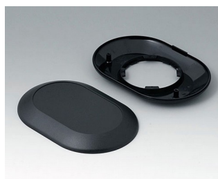
B5015009 Bottom and top part O160 F ABS (UL 94 HB) black RAL 9005 160x110x30mm