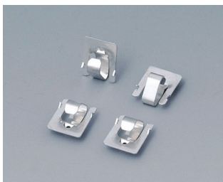
A9166001 Set of battery clips, 2 x AAA Steel tin-plated