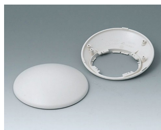
B5010307 Bottom and top part R110 H ABS (UL 94 HB) off-white RAL 9002 ø110x41mm