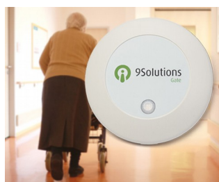
Access management in care facilities