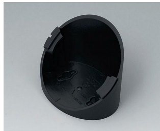
B5011319 Base 55° ABS (UL 94 HB) black RAL 9005