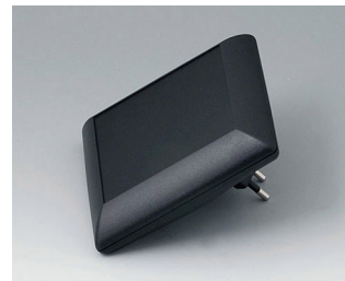
B5013229 ART-CASE S110 F PC+ABS (UL 94 V-0) black RAL 9005 110x110x38mm IP 40