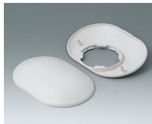
B5015307 Bottom and top part O160 H ABS (UL 94 HB) off-white RAL 9002 160x110x41mm