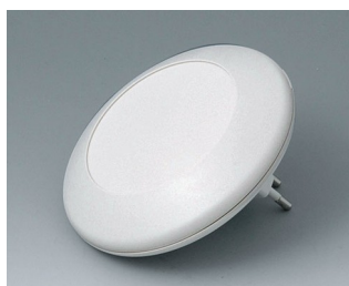
B5011227 ART-CASE R110 F PC+ABS (UL 94 V-0) off-white RAL 9002 ø110x38mm IP 40