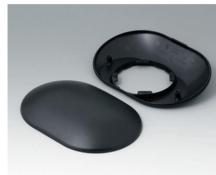
B5015309 Bottom and top part O160 H ABS (UL 94 HB) black RAL 9005 160x110x41mm