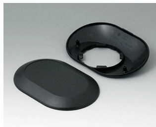
B5015209 Bottom and top part O160 F ABS (UL 94 HB) black RAL 9005 160x110x38mm