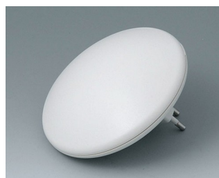
B5011327 ART-CASE R110 H PC+ABS (UL 94 V-0) off-white RAL 9002 ø110x41mm IP 40