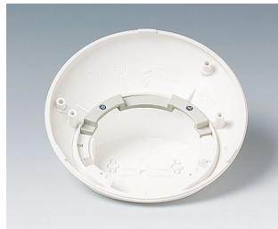
B5111707 Anti-rotation device ABS (UL 94 HB) off-white RAL 9002