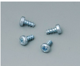
B5111201 Set of screws