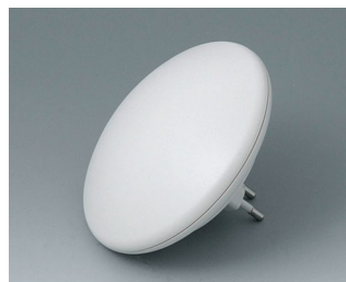
B5011127 ART-CASE R110 H PC+ABS (UL 94 V-0) off-white RAL 9002 ø110x38mm IP 40