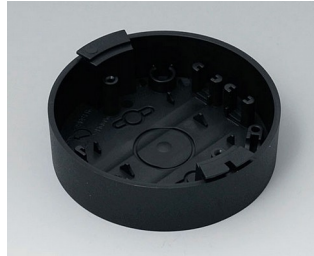
B5011119 Base ABS (UL 94 HB) black RAL 9005