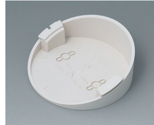
B5011217 Base 30° ABS (UL 94 HB) off-white RAL 9002