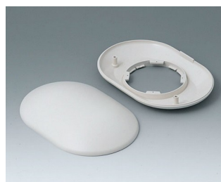
B5015107 Bottom and top part O160 H ABS (UL 94 HB) off-white RAL 9002 160x110x38mm