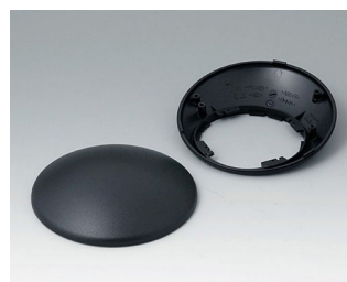
B5010309 Bottom and top part R110 H ABS (UL 94 HB) black RAL 9005 ø110x41mm