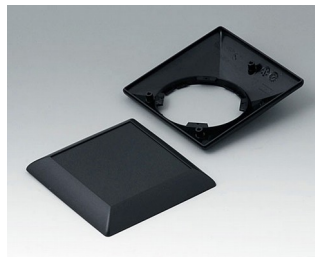
B5012209 Bottom and top part S110 F ABS (UL 94 HB) black RAL 9005 110x110x38mm