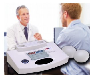
Multiple analytical resonance system