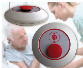
Radio paging mushroom-type button