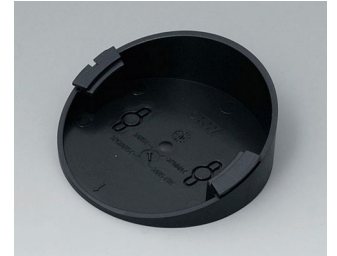
B5011219 Base 30° ABS (UL 94 HB) black RAL 9005