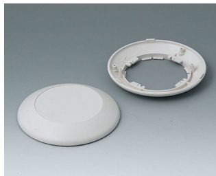
B5010007 Bottom and top part R110 F ABS (UL 94 HB) off-white RAL 9002 ø110x30mm