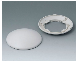
B5010107 Bottom and top part R110 H ABS (UL 94 HB) off-white RAL 9002 ø110x38mm