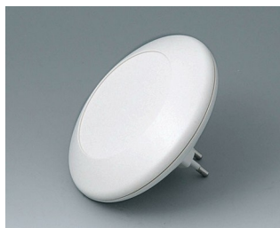
B5011027 ART-CASE R110 F PC+ABS (UL 94 V-0) off-white RAL 9002 ø110x30mm IP 40