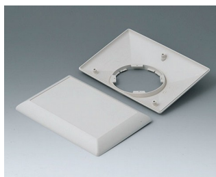
B5017207 Bottom and top part E160 F ABS (UL 94 HB) off-white RAL 9002 160x110x38mm