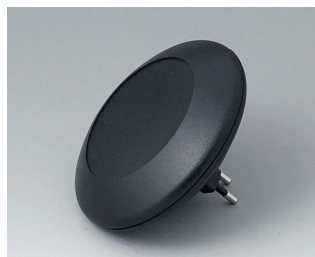
B5011029 ART-CASE R110 F PC+ABS (UL 94 V-0) black RAL 9005 ø110x30mm IP 40