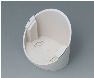
B5011317 Base 55° ABS (UL 94 HB) off-white RAL 9002