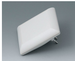
B5013227 ART-CASE S110 F PC+ABS (UL 94 V-0) off-white RAL 9002 110x110x38mm IP 40