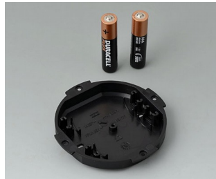
B5111109 Battery compartment, 2 x AAA ABS (UL 94 HB) black RAL 9005