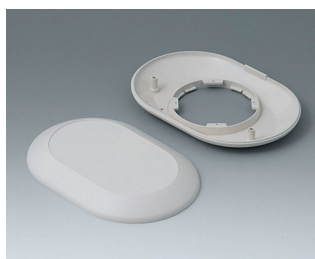
B5015007 Bottom and top part O160 F ABS (UL 94 HB) off-white RAL 9002 160x110x30mm