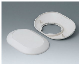
B5015207 Bottom and top part O160 F ABS (UL 94 HB) off-white RAL 9002 160x110x38mm