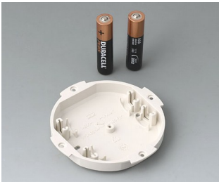
B5111107 Battery compartment, 2 x AAA ABS (UL 94 HB) off-white RAL 9002