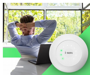
CO2 sensor traffic light