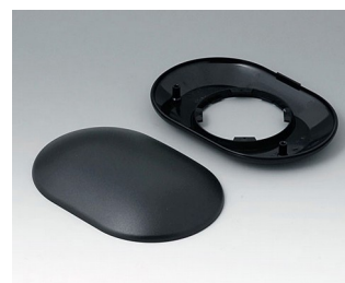
B5015109 Bottom and top part O160 H ABS (UL 94 HB) black RAL 9005 160x110x38mm