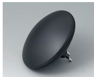
B5011129 ART-CASE R110 H PC+ABS (UL 94 V-0) black RAL 9005 ø110x38mm IP 40