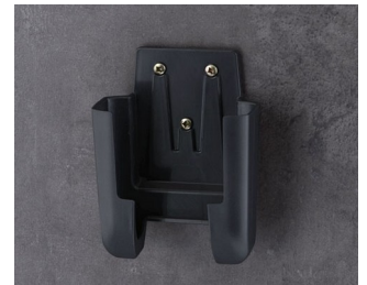
A9106628 Holder M ASA+PC (UL 94 V-0) lava