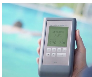
Electronic pool tester