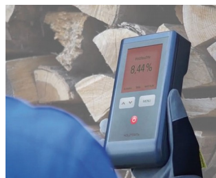
Wood moisture measuring device