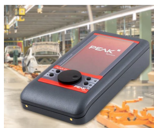
Mobile diagnostic device for CAN and CAN FD buses