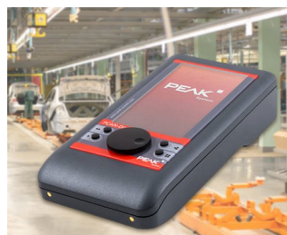
Mobile diagnostic device for CAN and CAN FD buses