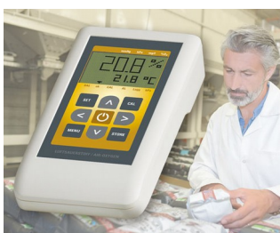
Atmospheric oxygen measuring unit