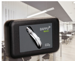
Sensor for measuring carbon dioxide concentration