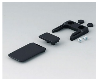
A9152049 Combi-Clip ABS (UL 94 HB) black RAL 9005 45x27mm