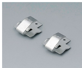
A9174006 Set of battery clips, 1 x 9 V Steel tin-plated