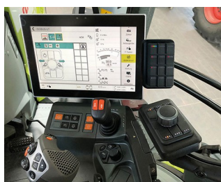
Digital joystick for ISO bus machines