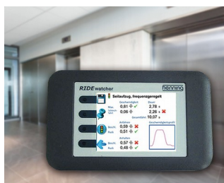
RIDEwatcher Multimeter for ride profiles