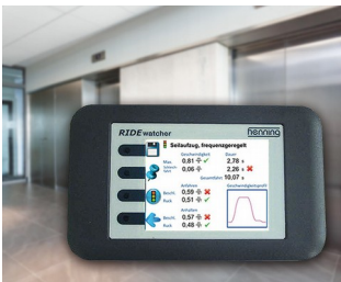
RIDEwatcher Multimeter for ride profiles