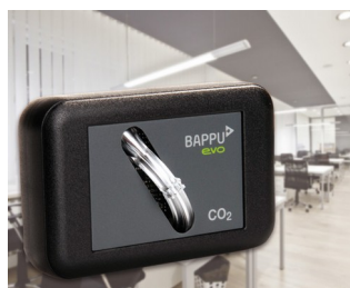
Sensor for measuring carbon dioxide concentration