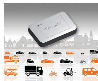
Module for smart mobility applications