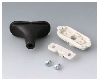
B2911319 Cable gland kit, 4.2 - 5.0 TPE black RAL 9005