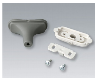
B2911308 Cable gland kit, 3.4 - 4.2 TPE volcano