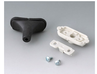
B2911309 Cable gland kit, 3.4 - 4.2 TPE black RAL 9005