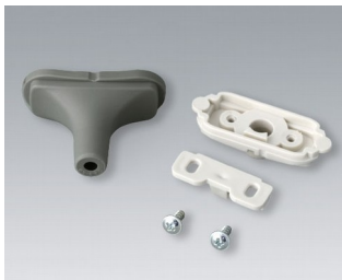
B2911318 Cable gland kit, 4.2 - 5.0 TPE volcano