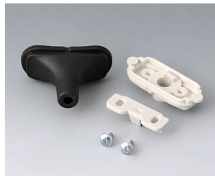
B2911319 Cable gland kit, 4.2 - 5.0 TPE black RAL 9005