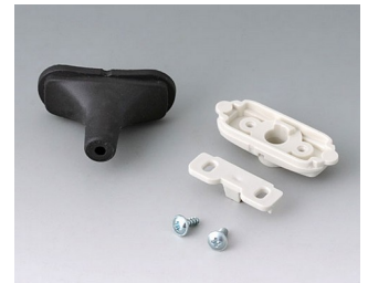
B2911309 Cable gland kit, 3.4 - 4.2 TPE black RAL 9005