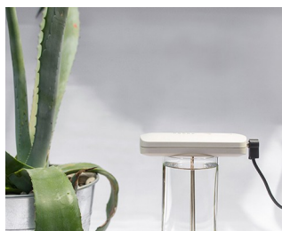
Tool for making colloidal silver solutions