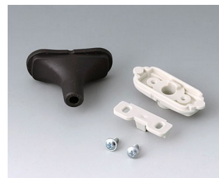
B2911329 Cable gland kit, 5.0 - 5.9 TPE black RAL 9005