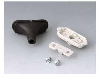
B2911329 Cable gland kit, 5.0 - 5.9 TPE black RAL 9005