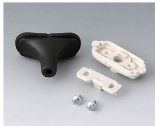
B2911319 Cable gland kit, 4.2 - 5.0 TPE black RAL 9005