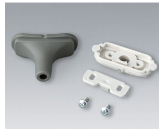
B2911328 Cable gland kit, 5.0 - 5.9 TPE volcano