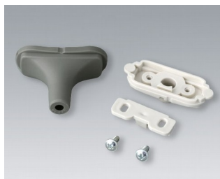
B2911318 Cable gland kit, 4.2 - 5.0 TPE volcano