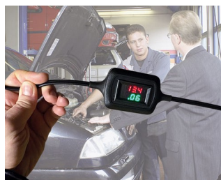
Voltage and current display during trickle charging