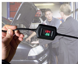
Voltage and current display during trickle charging