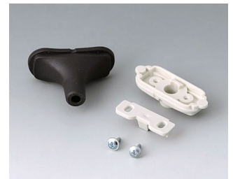
B2911329 Cable gland kit, 5.0 - 5.9 TPE black RAL 9005