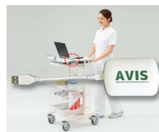
Receiver and data transfer for EMR