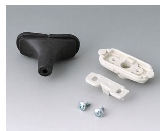
B2911309 Cable gland kit, 3.4 - 4.2 TPE black RAL 9005