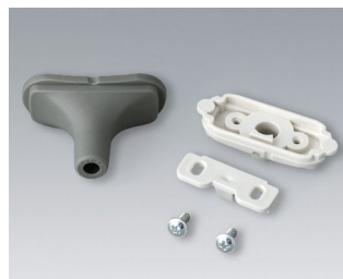
B2911328 Cable gland kit, 5.0 - 5.9 TPE volcano