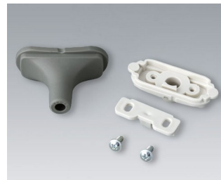
B2911328 Cable gland kit, 5.0 - 5.9 TPE volcano