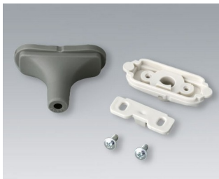
B2911318 Cable gland kit, 4.2 - 5.0 TPE volcano