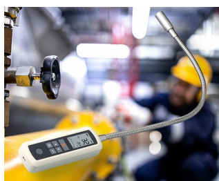
Gas leak detector