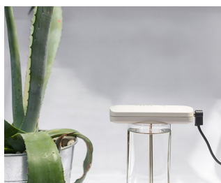
Tool for making colloidal silver solutions