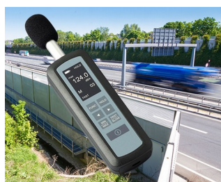
Noise level measurement