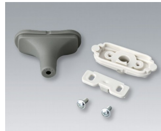
B2911308 Cable gland kit, 3.4 - 4.2 TPE volcano