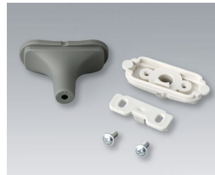
B2911308 Cable gland kit, 3.4 - 4.2 TPE volcano