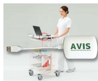
Receiver and data transfer for EMR