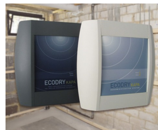
Systems for drying brickwork