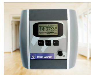
House control unit