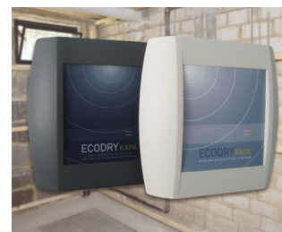
Systems for drying brickwork