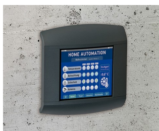
Control panel for home automation