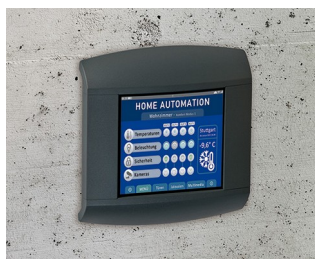
Control panel for home automation