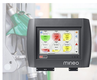
Controller for intelligent tank management