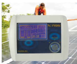
Control unit for photovoltaic solar installations