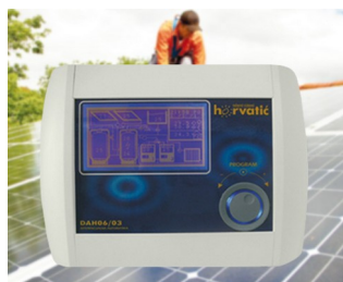
Control unit for photovoltaic solar installations