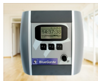
House control unit