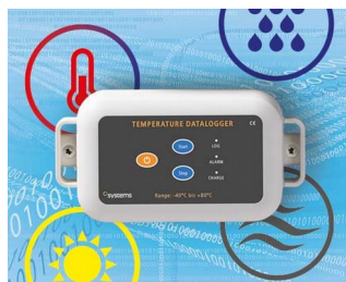
Data logger e.g. for temperature