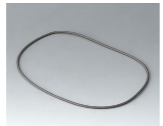
A9504030 Sealing 150