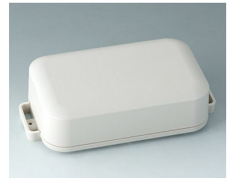
C3208207 EASYTEC 150 ASA+PC (UL 94 V-0) off-white RAL 9002 172x93x46mm IP 65 opt., IP 40