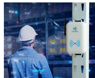
Smart store logistics