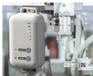
Data logger with gateway function