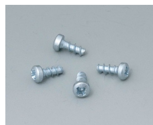
A9199008 Set of screws