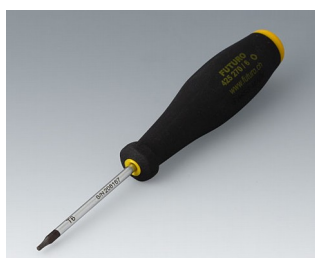
A0399T06 Torx T6 screwdriver