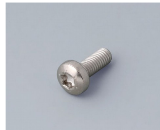
A0330080 Screw M3 x 8 mm (T10) Stainless steel