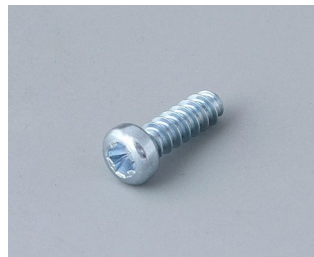
A0325080 Self-tapping screws 2.5 x 8 mm (PZ1)