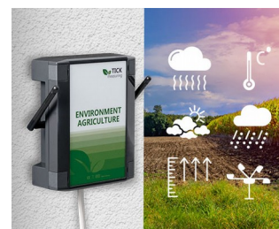
Weather station in agriculture