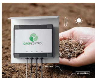
Smart Farming - system for long-term measurements