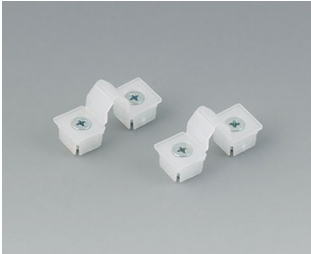
C2299031 Securing hinge for the cover PP natural-coloured