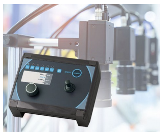
Camera control in production