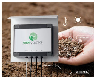
Smart Farming - system for long-term measurements