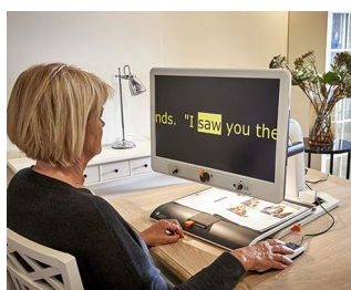
Control knobs for video magnifier