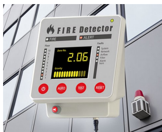
Terminal for fire alarm systems