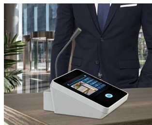
Table microphone / inter phone