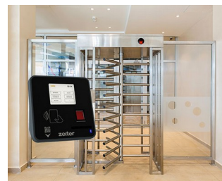
Terminal for access control