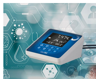
Laboratory measuring device