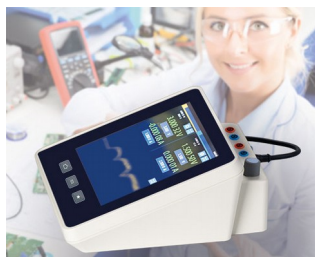
Multimeter measuring device