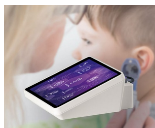
Hearing test device