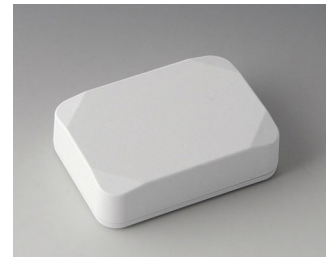
B1824217 MINI-DATA-BOX E50, hoch ASA+PC (UL 94 V-0) verkehrsweiß RAL 9016 70x50x20mm IP 65 opt., IP 40