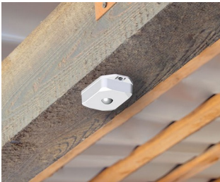
Bewegungsmelder mit Sensor zur automatischen Steuerung