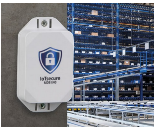
Zugriffsberechtigungen von Transpondern steuern