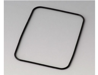
B1924101 Dichtung E50/EF50

Technische Änderungen vorbehalten. © OKW Gehäusesysteme, Buchen/Deutschland.