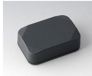
B1822218 MINI-DATA-BOX E40, hoch ASA+PC (UL 94 V-0) anthrazitgrau RAL 7016 60x40x20mm IP 65 opt., IP 40