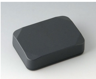
B1824218 MINI-DATA-BOX E50, hoch ASA+PC (UL 94 V-0) anthrazitgrau RAL 7016 70x50x20mm IP 65 opt., IP 40