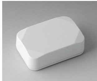
B1822217 MINI-DATA-BOX E40, hoch ASA+PC (UL 94 V-0) verkehrsweiß RAL 9016 60x40x20mm IP 65 opt., IP 40