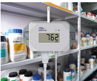
Gasdetektor für Gefahrstoffe