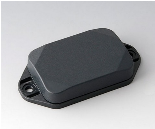
B1822128 MINI-DATA-BOX EF40, flach, mit Flansch ASA+PC (UL 94 V-0) anthrazitgrau RAL 7016 60x40x15mm IP 65 opt., IP 40