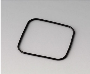
B1902101 Dichtung S40/SF40