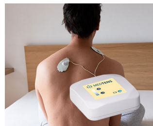
TENS-Gerät für Schmerztherapie