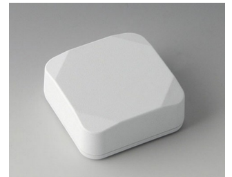
B1804217 MINI-DATA-BOX S50, hoch ASA+PC (UL 94 V-0) verkehrsweiß RAL 9016 50x50x20mm IP 65 opt., IP 40