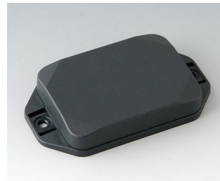
B1824128 MINI-DATA-BOX EF50, flach, mit Flansch ASA+PC (UL 94 V-0) anthrazitgrau RAL 7016 70x50x15mm IP 65 opt., IP 40