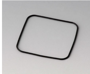
B1904101 Dichtung S50/SF50