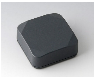
B1804218 MINI-DATA-BOX S50, hoch ASA+PC (UL 94 V-0) anthrazitgrau RAL 7016 50x50x20mm IP 65 opt., IP 40