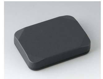
B1824118 MINI-DATA-BOX E50, flach ASA+PC (UL 94 V-0) anthrazitgrau RAL 7016 70x50x15mm IP 65 opt., IP 40