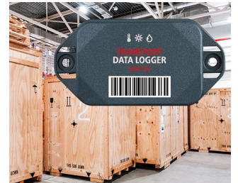
Datenlogger im Transportwesen