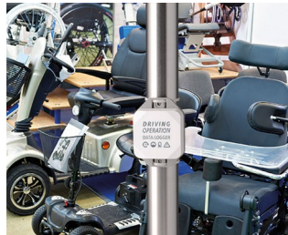
Datenlogger für den Fahrbetrieb