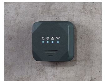
Wireless Access Point