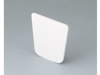
B2903031 Klebefolie M