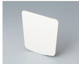
B2904031 Klebefolie L