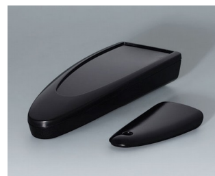
B2803016 STYLE-CASE M PMMA (IR) (UL 94 HB) schwarz RAL 9005 147x56x27mm IP 65 opt., IP 40