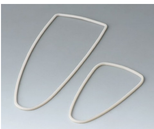
B2904111 Dichtungs-Set L TPV 50A