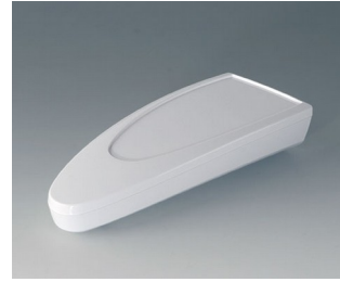
B2804027 STYLE-CASE L ASA (UL 94 HB) verkehrsweiß RAL 9016 166x64x31mm IP 65 opt., IP 40