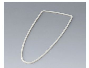
B2904011 Dichtung L TPV 50A