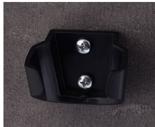
B2903039 Halter M ASA (UL 94 HB) schwarz RAL 9005