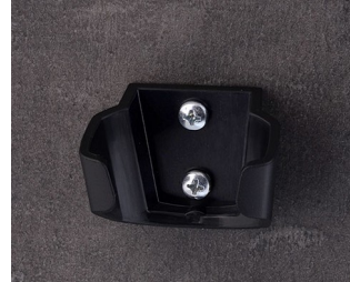
B2902039 Halter S ASA (UL 94 HB) schwarz RAL 9005