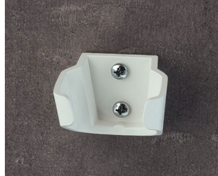
B2902037 Halter S ASA (UL 94 HB) verkehrsweiß RAL 9016