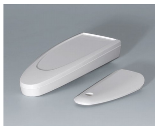
B2802017 STYLE-CASE S ASA (UL 94 HB) verkehrsweiß RAL 9016 123x48x24mm IP 40