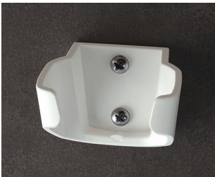
B2903037 Halter M ASA (UL 94 HB) verkehrsweiß RAL 9016