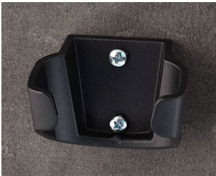
B2904039 Halter L ASA (UL 94 HB) schwarz RAL 9005