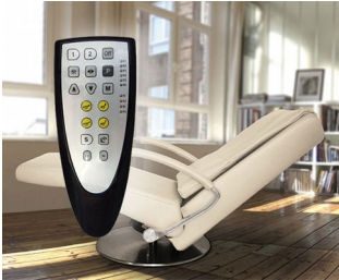
Bedienteil für Relax- und Massagesessel