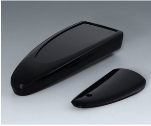
B2804016 STYLE-CASE L PMMA (IR) (UL 94 HB) schwarz RAL 9005 166x64x31mm IP 65 opt., IP 40