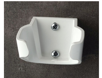
B2904037 Halter L ASA (UL 94 HB) verkehrsweiß RAL 9016