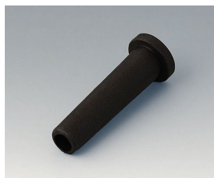
C2353849 Knickschutztüle Ø 5,3 schwarz