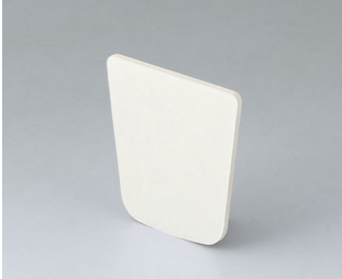
B2902031 Klebefolie S