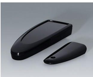
B2802016 STYLE-CASE S PMMA (IR) (UL 94 HB) schwarz RAL 9005 123x48x24mm IP 40