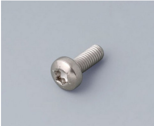
A0330080 Schraube M3 x 8 mm (T10) Edelstahl