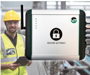
Industrial Secure Gateway