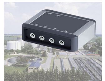
Prozessüberwachung von Anlagen