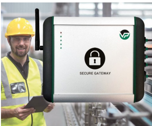
Industrial Secure Gateway