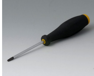
A0399T10 Torx Schraubendreher T10