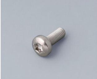
A0330080 Schraube M3 x 8 mm (T10) Edelstahl