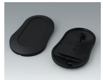
B9004906 Unter- und Oberteil DM PMMA (IR) (UL 94 HB) schwarz RAL 9005 70x44x16mm