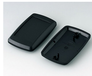
B9006806 Unter- und Oberteil EL PMMA (IR) (UL 94 HB) schwarz RAL 9005 78x48x20mm