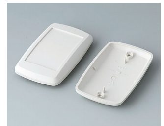
B9006807 Unter- und Oberteil EL ABS (UL 94 HB) grauweiß RAL 9002 78x48x20mm