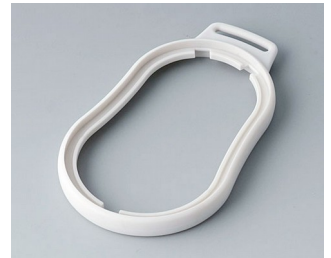
B9006307 Zwischenring DL SEBS (TPE) grauweiß RAL 9002