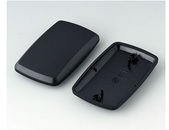
B9006856 Unter- und Oberteil EL PMMA (IR) (UL 94 HB) schwarz RAL 9005 78x48x20mm