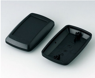
B9006826 Unter- und Oberteil EL PMMA (IR) (UL 94 HB) schwarz RAL 9005 78x48x26mm