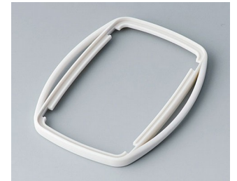
B9006757 Zwischenring EL SEBS (TPE) grauweiß RAL 9002