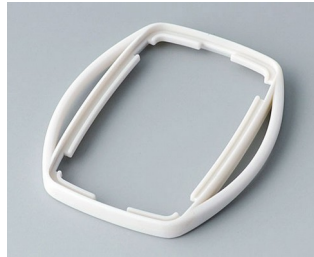
B9002757 Zwischenring ES TPE grauweiß RAL 9002