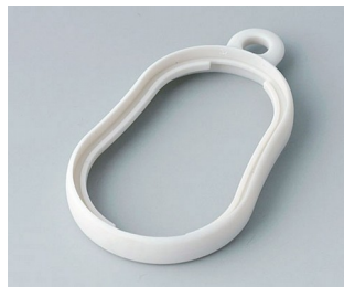
B9002357 Zwischenring DS SEBS (TPE) grauweiß RAL 9002