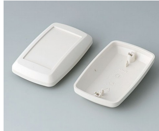
B9006827 Unter- und Oberteil EL ABS (UL 94 HB) grauweiß RAL 9002 78x48x26mm