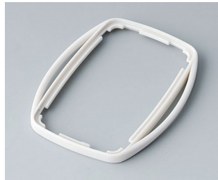
B9004757 Zwischenring EM SEBS (TPE) grauweiß RAL 9002