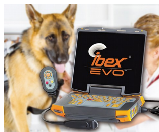
Portables Ultraschallgerät für die Veterinärmedizin