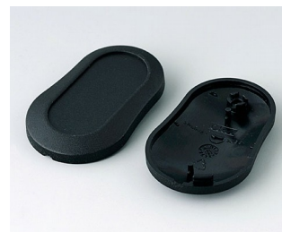
B9002906 Unter- und Oberteil DS PMMA (IR) (UL 94 HB) schwarz RAL 9005 51x32x13mm