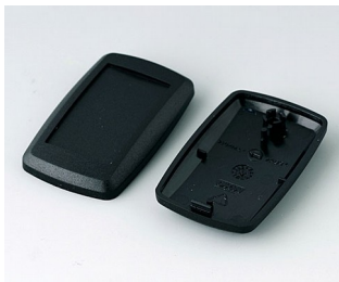
B9002806 Unter- und Oberteil ES PMMA (IR) (UL 94 HB) schwarz RAL 9005 52x32x15mm