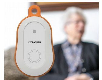
LoRa GPS-Tracker mit Alarmknopf