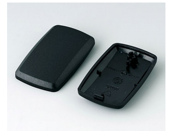
B9002856 Unter- und Oberteil ES PMMA (IR) (UL 94 HB) schwarz RAL 9005 52x32x15mm