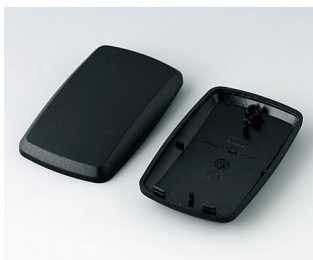
B9004856 Unter- und Oberteil EM PMMA (IR) (UL 94 HB) schwarz RAL 9005 68x42x18mm