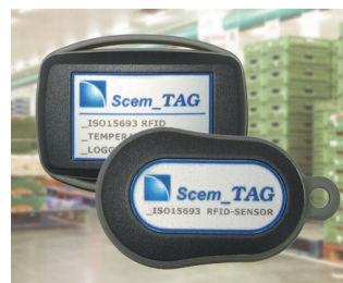
RFID Sensortransponder und Datenlogger