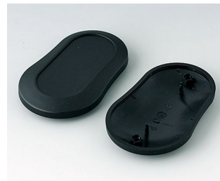
B9006906 Unter- und Oberteil DL PMMA (IR) (UL 94 HB) schwarz RAL 9005 84x53x19mm