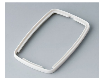
B9006787 Zwischenring EL SEBS (TPE) grauweiß RAL 9002