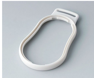
B9004307 Zwischenring DM SEBS (TPE) grauweiß RAL 9002