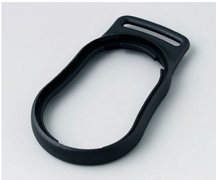
B9002306 Zwischenring DS PMMA (IR) (UL 94 HB) schwarz RAL 9005