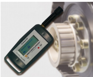
Tension-Meter zur Messung der Riemenvorspannung