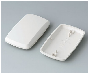
B9006857 Unter- und Oberteil EL ABS (UL 94 HB) grauweiß RAL 9002 78x48x20mm