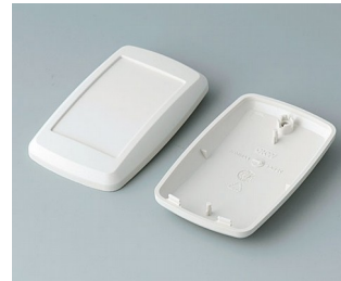
B9004807 Unter- und Oberteil EM ABS (UL 94 HB) grauweiß RAL 9002 68x42x18mm