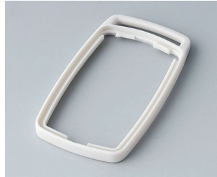
B9002707 Zwischenring ES TPE grauweiß RAL 9002