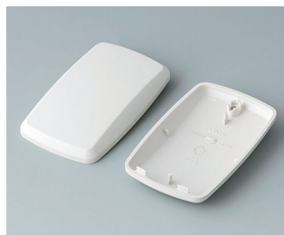
B9004857 Unter- und Oberteil EM ABS (UL 94 HB) grauweiß RAL 9002 68x42x18mm