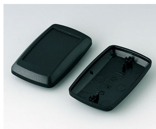
B9006816 Unter- und Oberteil EL PMMA (IR) (UL 94 HB) schwarz RAL 9005 78x48x24mm