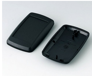
B9004806 Unter- und Oberteil EM PMMA (IR) (UL 94 HB) schwarz RAL 9005 68x42x18mm