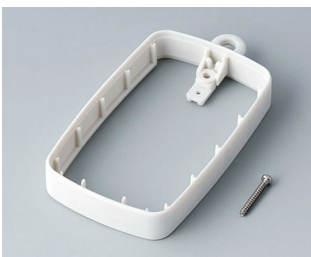
B9004787 Zwischenring EM, hoch SEBS (TPE) grauweiß RAL 9002