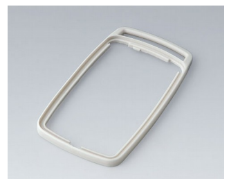
B9006707 Zwischenring EL SEBS (TPE) grauweiß RAL 9002