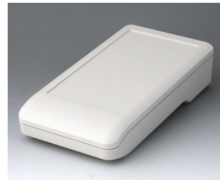
A9007117 DATEC-COMPACT L ASA+PC (UL 94 V-0) grauweiß RAL 9002 206x110x47mm IP 41