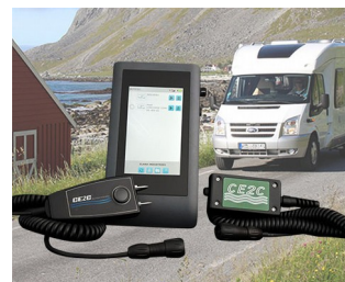
System zur Feuchtigkeitskontrolle an Freizeit-Fahrzeugen