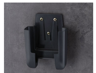
A9106628 Halter M ASA+PC (UL 94 V-0) lava