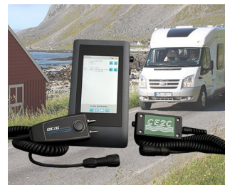
System zur Feuchtigkeitskontrolle an Freizeit-Fahrzeugen