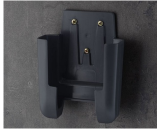
A9107628 Halter L ASA+PC (UL 94 V-0) lava