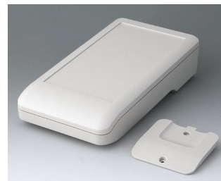
A9007217 DATEC-COMPACT L ASA+PC (UL 94 V-0) grauweiß RAL 9002 206x110x47mm IP 41