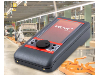
Mobiles Diagnosegerät für CAN- und CAN-FD-Busse