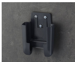
A9105628 Halter S ASA+PC (UL 94 V-0) lava