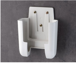
A9107627 Halter L ASA+PC (UL 94 V-0) grauweiß RAL 9002