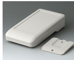
A9006217 DATEC-COMPACT M ASA+PC (UL 94 V-0) grauweiß RAL 9002 172x92x39mm IP 41