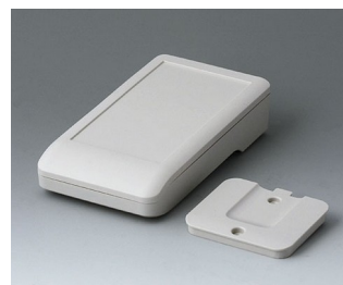
A9005217 DATEC-COMPACT S ASA+PC (UL 94 V-0) grauweiß RAL 9002 136x74x32mm IP 41