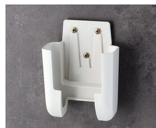
A9106627 Halter M ASA+PC (UL 94 V-0) grauweiß RAL 9002