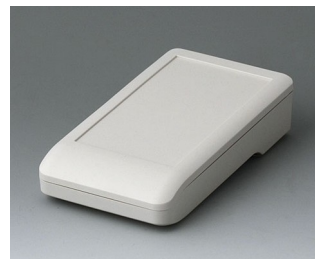
A9005117 DATEC-COMPACT S ASA+PC (UL 94 V-0) grauweiß RAL 9002 136x74x32mm IP 41