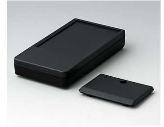
A9072219 DATEC-POCKET-BOX L PMMA (IR) (UL 94 HB) schwarz RAL 9005 120x65x22mm IP 54