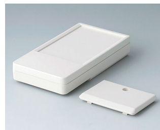
A9072117 DATEC-POCKET-BOX L ABS (UL 94 HB) grauweiß RAL 9002 120x65x22mm IP 54