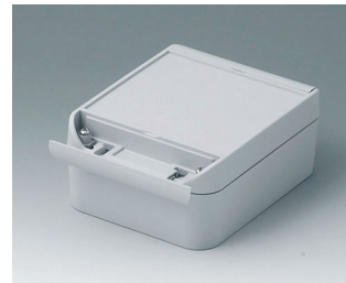
C6011141 SMART-BOX 110 BREIT ASA+PC (UL 94 V-0) lichtgrau RAL 7035 140x110x60mm IP 66