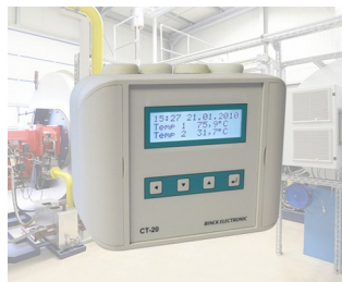
Universeller Temperaturregler / Temperatur-Differenzregler