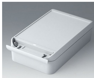
C6013221 SMART-BOX 130 BREIT ASA+PC (UL 94 V-0) lichtgrau RAL 7035 220x130x60mm IP 66