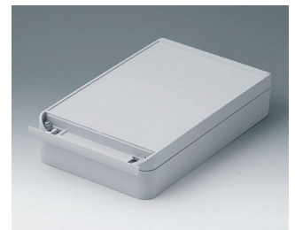
C6017281 SMART-BOX 170 BREIT ASA+PC (UL 94 V-0) lichtgrau RAL 7035 280x170x60mm IP 65