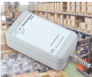
Aktives UHF RFID-System