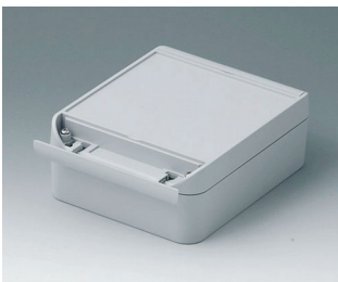
C6013161 SMART-BOX 130 BREIT ASA+PC (UL 94 V-0) lichtgrau RAL 7035 160x130x60mm IP 66