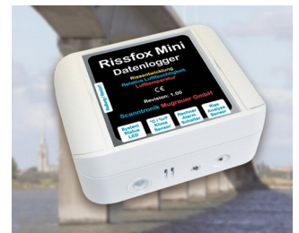
Miniatur-Datenlogger für Rissbewegungen und Klimadaten