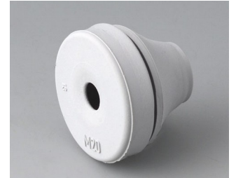
C2320137 Kabeldurchführung EPDM lichtgrau RAL 7035 IP 67