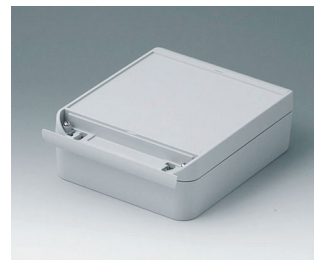
C6015181 SMART-BOX 150 BREIT ASA+PC (UL 94 V-0) lichtgrau RAL 7035 180x150x60mm IP 66