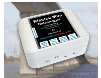
Miniatur-Datenlogger für Rissbewegungen und Klimadaten