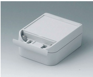
C6009121 SMART-BOX 90 BREIT ASA+PC (UL 94 V-0) lichtgrau RAL 7035 120x90x50mm IP 66