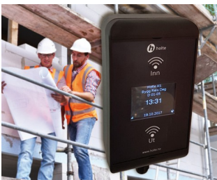
RFID-Kartenleser für Baustellen-Mitarbeiter