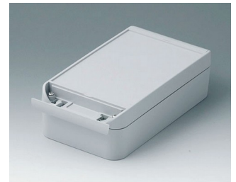
C6011201 SMART-BOX 110 BREIT ASA+PC (UL 94 V-0) lichtgrau RAL 7035 200x110x60mm IP 66