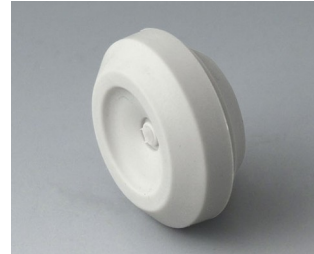
C2316147 Kabeldurchführung TPE lichtgrau RAL 7035 IP 67