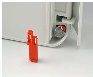
C6100006 Plombierstift PA 6 rot