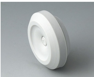
C2320147 Kabeldurchführung TPE lichtgrau RAL 7035 IP 67