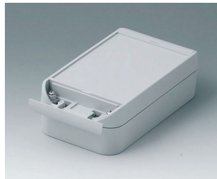
C6009161 SMART-BOX 90 BREIT ASA+PC (UL 94 V-0) lichtgrau RAL 7035 160x90x50mm IP 66