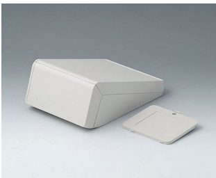
B4054307 UNITEC S, 0,6/0,6 ABS (UL 94 HB) grauweiß RAL 9002 125x177x69mm IP 40