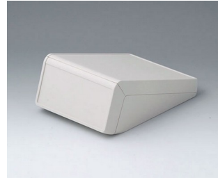
B4054127 UNITEC S, 1,4/0,6 ABS (UL 94 HB) grauweiß RAL 9002 125x177x69mm IP 40