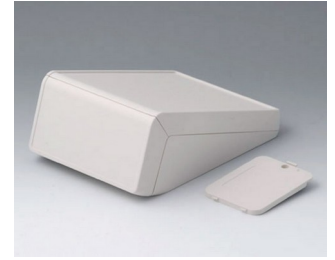
B4056237 UNITEC M, 0,6/1,4 ABS (UL 94 HB) grauweiß RAL 9002 148x210x80mm IP 40