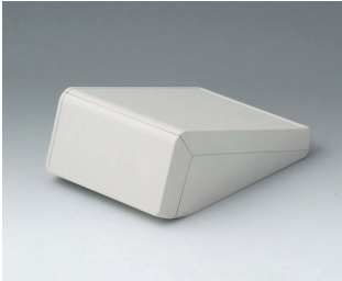
B4054107 UNITEC S, 0,6/0,6 ABS (UL 94 HB) grauweiß RAL 9002 125x177x69mm IP 40