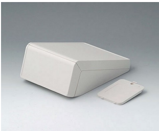
B4054207 UNITEC S, 0,6/0,6 ABS (UL 94 HB) grauweiß RAL 9002 125x177x69mm IP 40