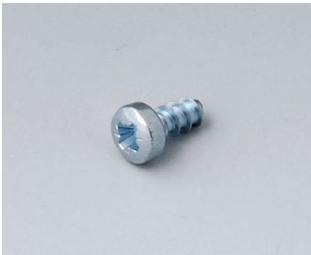
A0306031 Selbstformende Schraube 3 x 6 mm (PZ1)