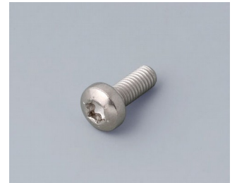
A0330080 Schraube M3 x 8 mm (T10) Edelstahl