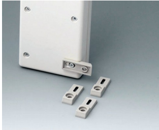
A9204108 Befestigungslaschen, Wand PA 6 kieselgrau RAL 7032