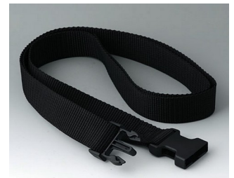
B7110149 Gurtband schwarz 1500x30mm