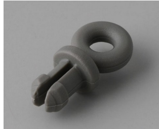
A9100002 Ringöse PA 6 vulkan