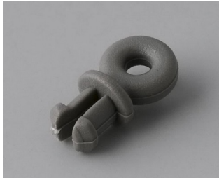
A9100001 Ringöse PA 6 vulkan