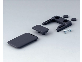
A9152048 Combi-Clip ABS (UL 94 HB) lava 45x27mm