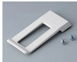
A9172107 Ansteckclip ABS (UL 94 HB) grauweiß RAL 9002 62x30mm