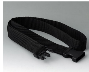
B7110139 Gurtband schwarz 1200x30mm