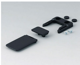
A9152049 Combi-Clip ABS (UL 94 HB) schwarz RAL 9005 45x27mm