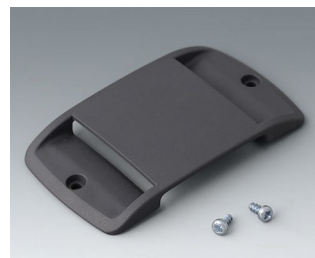
B9106128 Gurtschlaufen-Befestigung ABS (UL 94 HB) lava