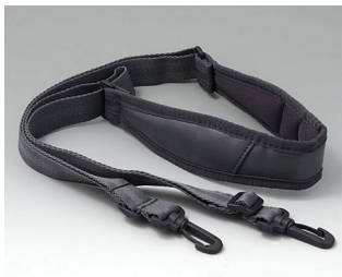
B4308650 Umhängegurt grau 1400mm