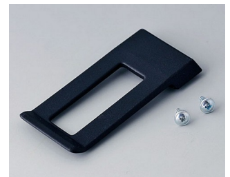
A9172109 Ansteckclip ABS (UL 94 HB) schwarz RAL 9005 62x30mm