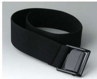
B7110129 Gurtband schwarz 450x35mm