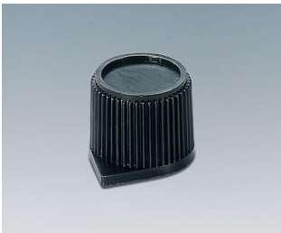
A1310560 DREHKNOPF, mit seidl. Schraubbefestigung PC schwarz RAL 9005 15,4x13,2mm 6mm