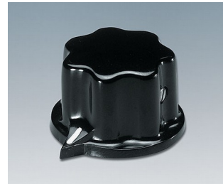
A1321060 DREHKNOPF, mit seidl. Schraubbefestigung PF (UL 94 V-0) schwarz RAL 9005 31x20mm 6mm