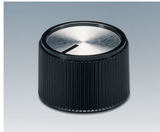
A1320260 DREHKNOPF, mit seittl. Schraubbefestigung PF schwarz/Alu 20x16mm 6mm