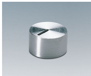
A1412441 DREHKNOPF, mit seittl. Schraubbefestigung PC glänzend 12x7,2mm 4mm