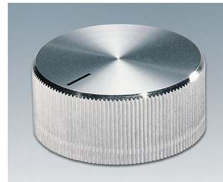
A1432261 DREHKNOPF, mit seittl. Schraubbefestigung ABS (UL 94 HB) glänzend 32,8x14,4mm 6mm