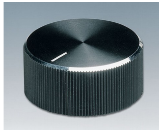
A1432260 DREHKNOPF, mit seittl. Schraubbefestigung ABS (UL 94 HB) schwarz/Alu 33x14,3mm 6mm