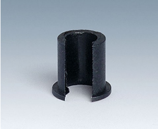
A1300040 Reduzierstück ABS (UL 94 HB) schwarz RAL 9005 7,4x7mm 4mm

Technische Änderungen vorbehalten. © OKW Gehäusesysteme, Buchen/Deutschland.