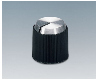
A1314240 DREHKNOPF, mit seidl. Schraubbefestigung PF schwarz/Alu 14,1x14mm 4mm