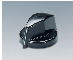
A1311860 DREHKNOPF, mit seidl. Schraubbefestigung PF schwarz RAL 9005 18,8x12,5mm 6mm