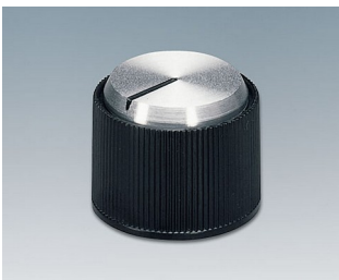
A1318260 DREHKNOPF, mit seidl. Schraubbefestigung ABS (UL 94 HB) schwarz/Alu 18,2x14,2mm 6mm