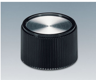
A1328160 DREHKNOPF, mit seittl. Schraubbefestigung PF schwarz/Alu 28x16mm 6mm