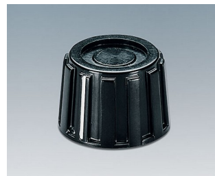
A1319260 DREHKNOPF, mit seidl. Schraubbefestigung PF schwarz RAL 9005 18,9x13,5mm 6mm