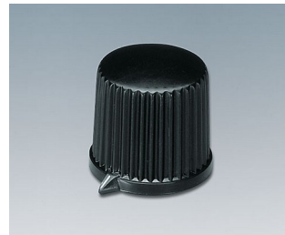
A1312560 DREHKNOPF, mit seidl. Schraubbefestigung ABS (UL 94 HB) schwarz RAL 9005 20,7x19,7mm 6mm