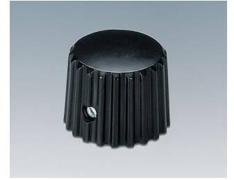
A1321160 DREHKNOPF, mit seittl. Schraubbefestigung ABS (UL 94 HB) schwarz RAL 9005 20x16mm 6mm