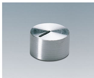
A1412441 DREHKNOPF, mit seidl. Schraubbefestigung PC glänzend 12x7,2mm 4mm