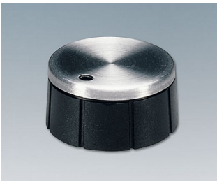
A1321260 DREHKNOPF, mit seittl. Schraubbefestigung PF schwarz/Alu 21x10mm 6mm