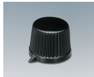
A1613560 DREHKNOPF, mit seittl. Schraubbefestigung ABS (UL 94 HB) schwarz RAL 9005 19,9x15,5mm 6mm