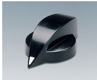
A1321860 DREHKNOPF, mit seittl. Schraubbefestigung PF schwarz RAL 9005 23x16mm 6mm