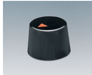
A1316240 DREHKNOPF, mit seidl. Schraubbefestigung ABS (UL 94 HB) schwarz RAL 9005 16,4x12,3mm 4mm