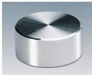
A1438461 DREHKNOPF, mit seittl. Schraubbefestigung ABS (UL 94 HB) glänzend 37,8x15,9mm 6mm