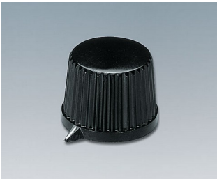
A1313560 DREHKNOPF, mit seidl. Schraubbefestigung PF schwarz RAL 9005 20x15,4mm 6mm