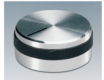
A1432469 DREHKNOPF, mit seittl. Schraubbefestigung ABS (UL 94 HB) glänzend 31,9x14mm 6mm