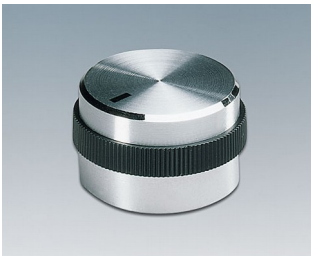
A1422469 DREHKNOPF, mit seittl. Schraubbefestigung ABS (UL 94 HB) glänzend 22,2x17,9mm 6mm