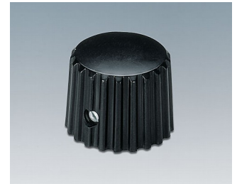
A1321160 DREHKNOPF, mit seidl. Schraubbefestigung ABS (UL 94 HB) schwarz RAL 9005 20x16mm 6mm