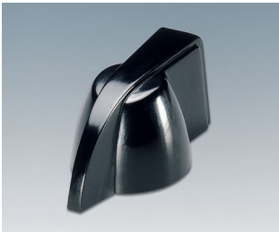
A1319860 DREHKNOPF, mit seidl. Schraubbefestigung PF (UL 94 V-0) schwarz RAL 9005 20,3x18mm 6mm