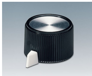
A1318560 DREHKNOPF, mit seidl. Schraubbefestigung PF schwarz/Alu 23,9x16mm 6mm