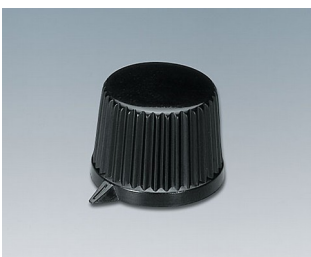
A1685540 DREHKNOPF, mit seittl. Schraubbefestigung PC schwarz RAL 9005 11,4x10,5mm 4mm