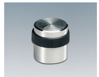
A1416449 DREHKNOPF, mit seidl. Schraubbefestigung ABS (UL 94 HB) glänzend 15,9x15mm 4mm