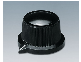
A1319560 DREHKNOPF, mit seidl. Schraubbefestigung PF schwarz RAL 9005 29x20,1mm 6mm