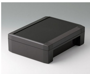
C8017221 SOLID-BOX 175 PC+ABS (UL 94 V-0) anthrazitgrau RAL 7016 225x175x70mm IP 66, IP 67, IK 08