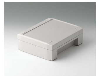
C8014182 SOLID-BOX 145 PC+ABS (UL 94 V-0) lichtgrau RAL 7035 180x145x60mm IP 66, IP 67, IK 08