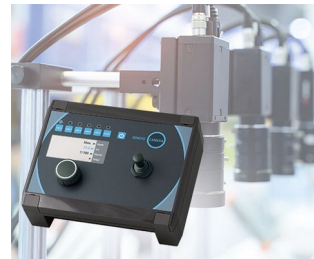
Kamera-Steuerung in der Produktion