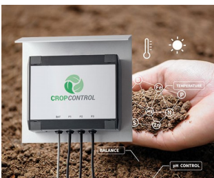
SMART FARMING - Messsystem für Langzeitmessungen