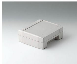
C8011132 SOLID-BOX 115 PC+ABS (UL 94 V-0) lichtgrau RAL 7035 135x115x50mm IP 66, IP 67, IK 08