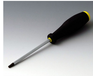
A0399T20 Torx Schraubendreher T20