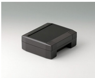
C8011131 SOLID-BOX 115 PC+ABS (UL 94 V-0) anthrazitgrau RAL 7016 135x115x50mm IP 66, IP 67, IK 08