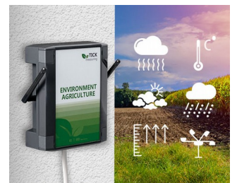
Wetterstation in der Landwirtschaft