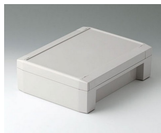
C8017222 SOLID-BOX 175 PC+ABS (UL 94 V-0) lichtgrau RAL 7035 225x175x70mm IP 66, IP 67, IK 08