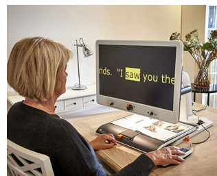
Bedienknöpfe für Bildschirmlesegerät