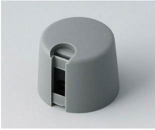
A1020648 TOP-KNOBS 20 PA 6 vulkan 20x16mm