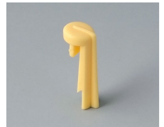
A1105004 Skala PA 6 (UL 94 HB) beach