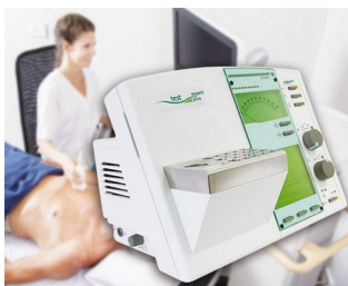
Bedienelement für ein Diagnose-Gerät