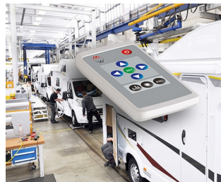
Fernbedienung für Interior Design