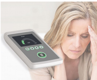
Biofeedback zum Stressabbau