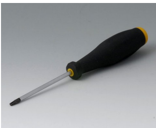
A0399T08 Torx Schraubendreher T8

Technische Änderungen vorbehalten.