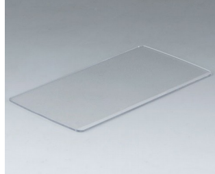
B5503201 Frontscheibe M PC transparent 125,3x63,5x1,3mm