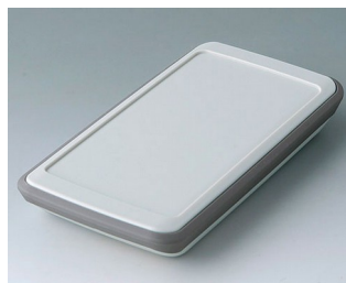
B5403317 SLIM-CASE M, Ausf. VI ASA+PC (UL 94 V-0) grauweiß RAL 9002 148x74x22mm IP 54