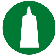
Konfektion / Montage