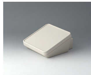
B4414307 PROTEC 140, Ausf. III ASA+PC (UL 94 V-0) grauweiß RAL 9002 140x160x76mm IP 65 opt.