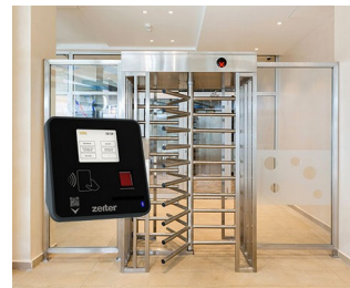
Terminal für Zutrittskontrolle