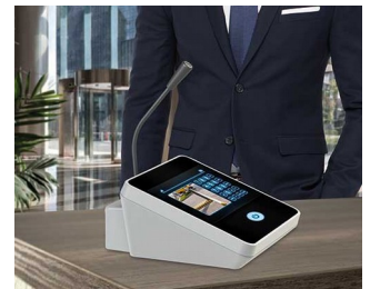
Tischmikrofon / Sprechanlage