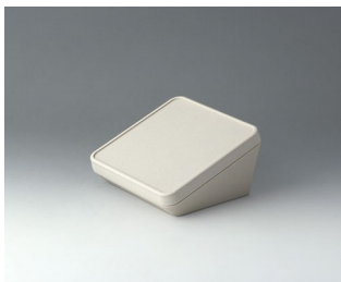
B4414107 PROTEC 140, Ausf. I ASA+PC (UL 94 V-0) grauweiß RAL 9002 140x140x76mm IP 65 opt.