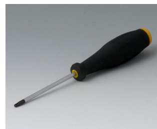
A0399T08 Torx Schraubendreher T8