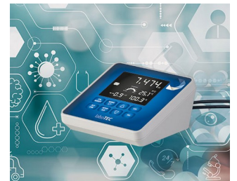
Messgerät im Labor