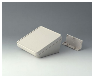
B4414207 PROTEC 140, Ausf. II ASA+PC (UL 94 V-0) grauweiß RAL 9002 140x140x76mm IP 65 opt.