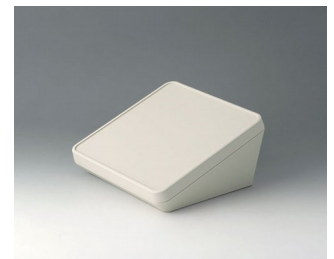
B4418107 PROTEC 180, Ausf. I ASA+PC (UL 94 V-0) grauweiß RAL 9002 180x180x92mm IP 65 opt.