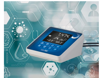
Messgerät im Labor