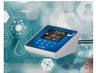
Messgerät im Labor