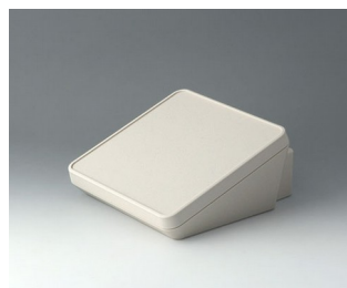
B4418307 PROTEC 180, Ausf. III ASA+PC (UL 94 V-0) grauweiß RAL 9002 180x201x92mm IP 65 opt.