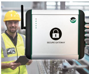
Industrial Secure Gateway