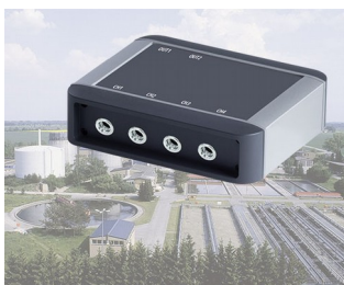
Process control of plants