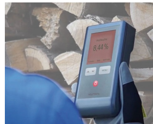
Wood moisture measuring device