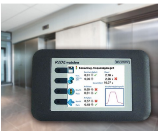
RIDEwatcher Multimeter for ride profiles