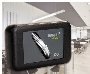
Sensor for measuring carbon dioxide concentration