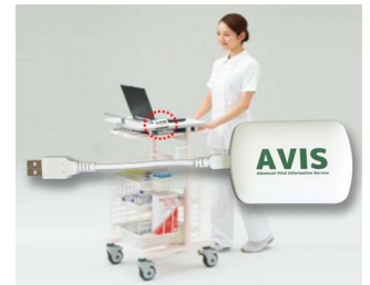
Receiver and data transfer for EMR