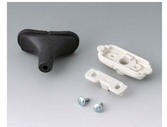
B2911309 Cable gland kit, 3.4 - 4.2 TPE black RAL 9005