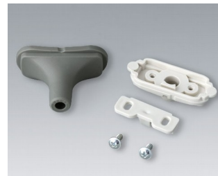
B2911328 Cable gland kit, 5.0 - 5.9 TPE volcano