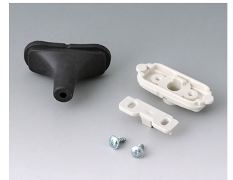
B2911309 Cable gland kit, 3.4 - 4.2 TPE black RAL 9005