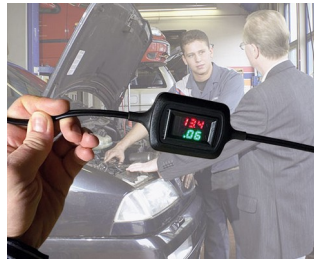
Voltage and current display during trickle charging