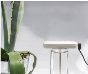
Tool for making colloidal silver solutions