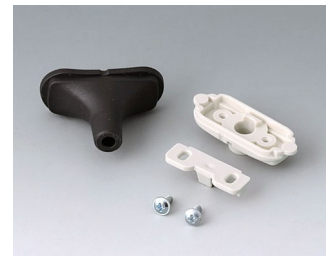
B2911329 Cable gland kit, 5.0 - 5.9 TPE black RAL 9005