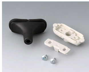
B2911319 Cable gland kit, 4.2 - 5.0 TPE black RAL 9005