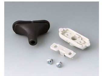
B2911329 Cable gland kit, 5.0 - 5.9 TPE black RAL 9005