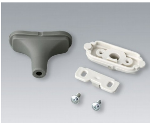
B2911318 Cable gland kit, 4.2 - 5.0 TPE volcano