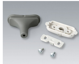
B2911308 Cable gland kit, 3.4 - 4.2 TPE volcano