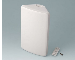
B4610107 SMART-CONTROL M, Vers. I ASA+PC (UL 94 V-0) off-white RAL 9002 173x101x59mm IP 55 opt., IP 40