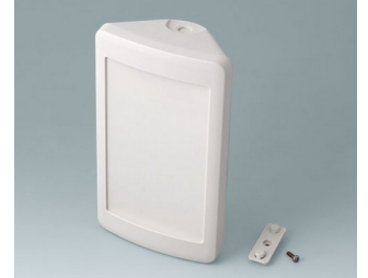
B4610207 SMART-CONTROL M, Vers. II ASA+PC (UL 94 V-0) off-white RAL 9002 173x101x59mm IP 55 opt., IP 40