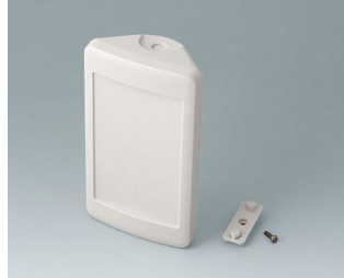
B4608207 SMART-CONTROL S, Vers. II ASA+PC (UL 94 V-0) off-white RAL 9002 142x81x46mm IP 55 opt., IP 40