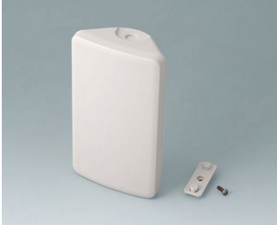
B4608107 SMART-CONTROL S, Vers. I ASA+PC (UL 94 V-0) off-white RAL 9002 142x81x46mm IP 55 opt., IP 40