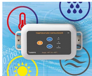
Data logger e.g. for temperature