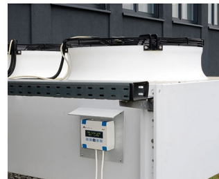
Heating/air conditioning/ventilation control