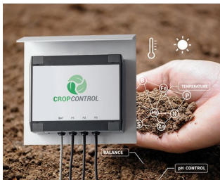
Smart Farming - system for long-term measurements