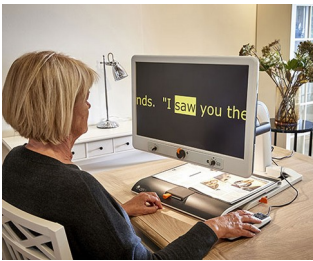
Control knobs for video magnifier