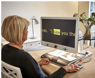
Control knobs for video magnifier