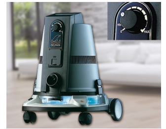
Operating element for a vacuum cleaner