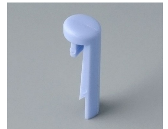
A1101006 Pin PA 6 (UL 94 HB) sky