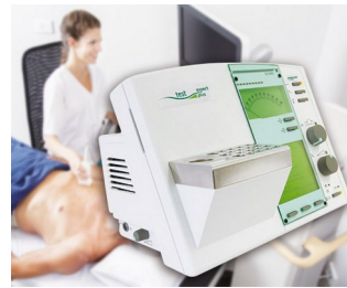
Operating element for a diagnostic device