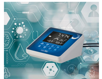
Laboratory measuring device