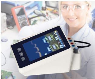
Multimeter measuring device