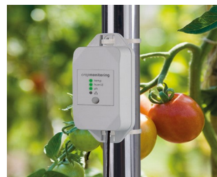
Enregistreur de données pour la gestion de l'usine