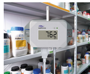
Détecteur de gaz pour substances dangereuses