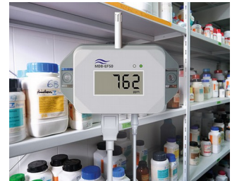
Détecteur de gaz pour substances dangereuses