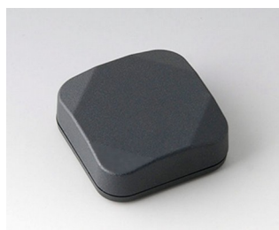
B1802118 MINI-DATA-BOX S40, plate ASA+PC (UL 94 V-0) gris anthracite RAL 7016 40x40x15mm IP 65 opt., IP 40