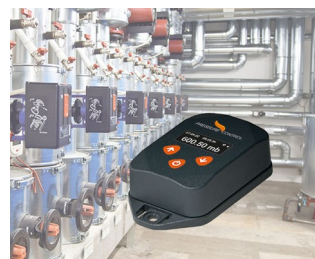
Contrôle de processus