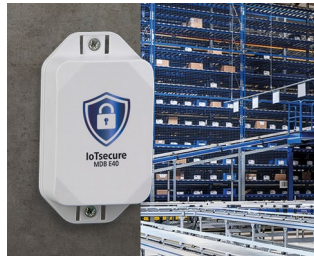
Autorisation d'accès des transpondeurs