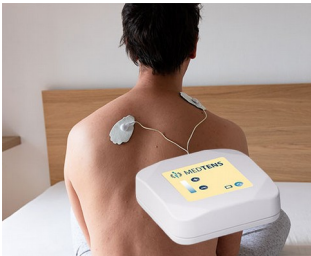
Appareil TENS pour le traitement de la douleur