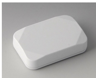
B1822117 MINI-DATA-BOX E40, plate ASA+PC (UL 94 V-0) blanc signalisation RAL 9016 60x40x15mm IP 65 opt., IP 40