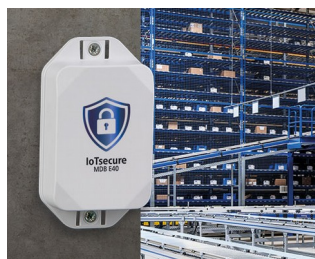
Autorisation d'accès des transpondeurs