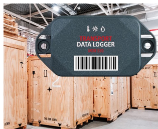
Enregistreur de données dans le transport