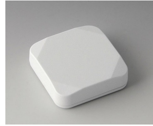
B1804117 MINI-DATA-BOX S50, plate ASA+PC (UL 94 V-0) blanc signalisation RAL 9016 50x50x15mm IP 65 opt., IP 40