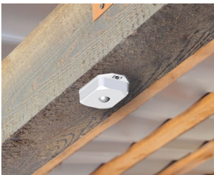
Détecteur de mouvement avec capteur pour contrôle automatique