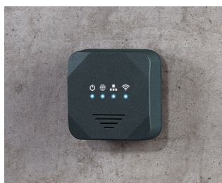
Point d'accès sans fil