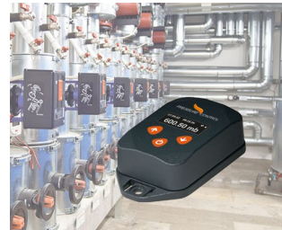
Contrôle de processus