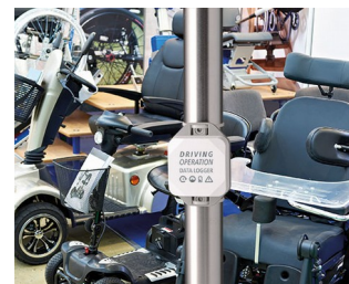
Enregistreur de données pour les opérations de conduite