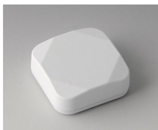
B1802117 MINI-DATA-BOX S40, plate ASA+PC (UL 94 V-0) blanc signalisation RAL 9016 40x40x15mm IP 65 opt., IP 40