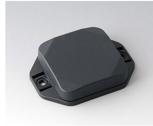
B1804128 MINI-DATA-BOX SF50, plate avec bride ASA+PC (UL 94 V-0) gris anthracite RAL 7016 50x50x15mm IP 65 opt., IP 40