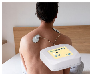
Appareil TENS pour le traitement de la douleur