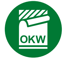
Étiquette, Films de décoration graphique