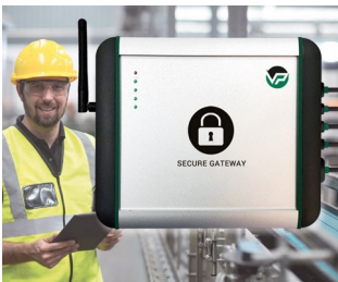
Industrial Secure Gateway