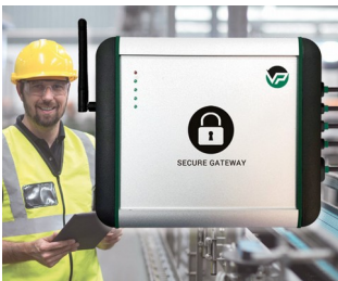
Industrial Secure Gateway