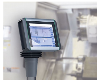
Panneau multi-touche pour le contrôle de la machine