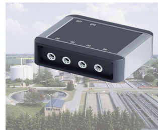
Contrôle de processus des usines