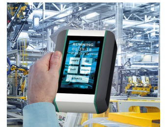
Système de surveillance en temps réel de la machine