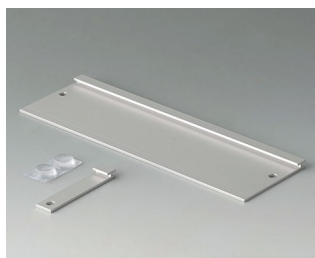
B3507020 Jeu de support mural Aluminium