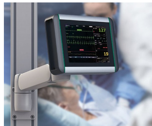
Moniteur de surveillance des signes vitaux