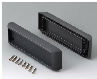
B3507011 Jeu de couvercles ASA+PC (UL 94 V-0) lava