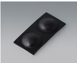
A9209229 Pieds anti-glissant 8,5 x 2,2 mm noir

Sous réserve de modifications techniques. © OKW Gehäusesysteme, Buchen/Allemagne.