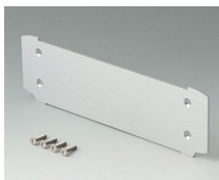
B3507025 Plaque de fermeture Aluminium anodisé mat