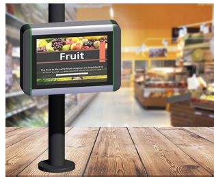
Borne d'information dans les points de vente