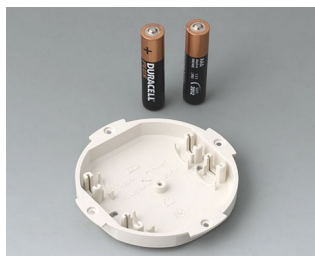
B5111107 Logement de pile, 2 x AAA ABS (UL 94 HB) gris blanc RAL 9002