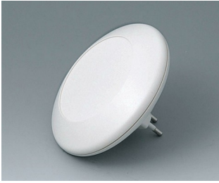
B5011027 ART-CASE R110 F PC+ABS (UL 94 V-0) gris blanc RAL 9002 ø110x30mm IP 40