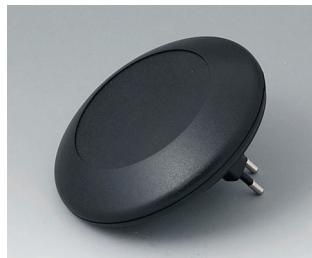
B5011229 ART-CASE R110 F PC+ABS (UL 94 V-0) noir RAL 9005 ø110x38mm IP 40