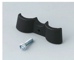
A9166003 Support de pile, 2 x AAA PA 6 (UL 94 HB) noir RAL 9005