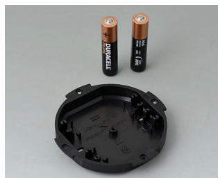
B5111109 Logement de pile, 2 x AAA ABS (UL 94 HB) noir RAL 9005