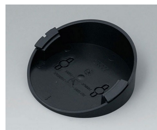
B5011219 Socle 30° ABS (UL 94 HB) noir RAL 9005