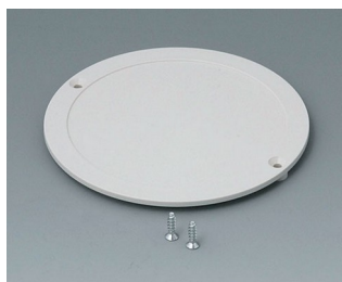
B5011857 Couverture du compartiment piles ABS (UL 94 HB) gris blanc RAL 9002