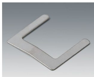
A9166002 Ressorts de contact, 2 x AAA Acier étamé