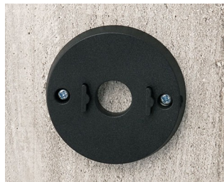
B5111309 Jeu de support mural ABS (UL 94 HB) noir RAL 9005