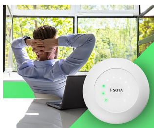
Feu de signalisation CO2 à capteur