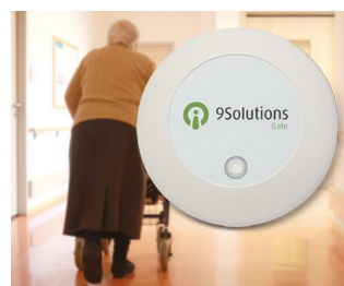
Gestion et contrôle d'accès