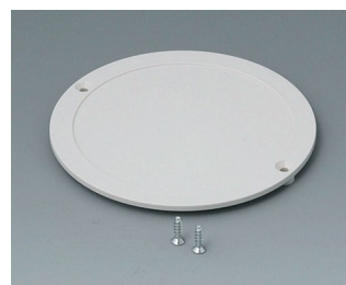
B5011847 Couvercle ABS (UL 94 HB) gris blanc RAL 9002