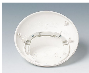
B5111707 Protection antitorsion ABS (UL 94 HB) gris blanc RAL 9002