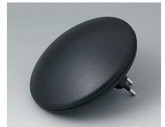
B5011329 ART-CASE R110 H PC+ABS (UL 94 V-0) noir RAL 9005 ø110x41mm IP 40