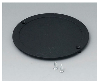
B5011859 Couverture du compartiment piles ABS (UL 94 HB) noir RAL 9005