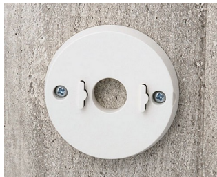
B5111307 Jeu de support mural ABS (UL 94 HB) gris blanc RAL 9002