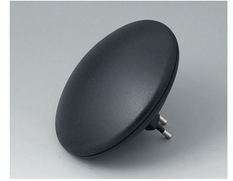
B5011129 ART-CASE R110 H PC+ABS (UL 94 V-0) noir RAL 9005 ø110x38mm IP 40