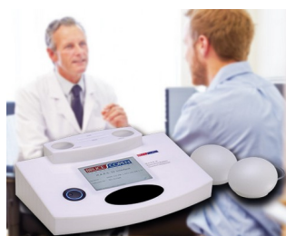
Système multiple d'analyse de résonances