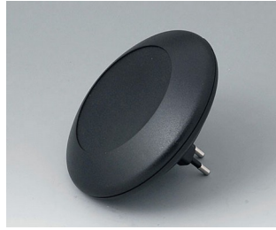
B5011029 ART-CASE R110 F PC+ABS (UL 94 V-0) noir RAL 9005 ø110x30mm IP 40