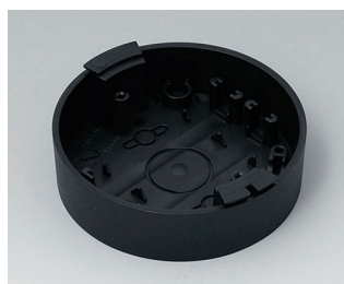
B5011119 Socle ABS (UL 94 HB) noir RAL 9005