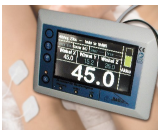
Mesure d'angle en 3D de systèmes d'articulations sur la base de la gravité