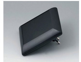
B5013229 ART-CASE S110 F PC+ABS (UL 94 V-0) noir RAL 9005 110x110x38mm IP 40