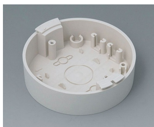
B5011117 Socle ABS (UL 94 HB) gris blanc RAL 9002