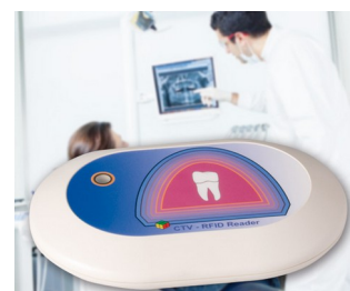
Lecteur RFID pour système CTV