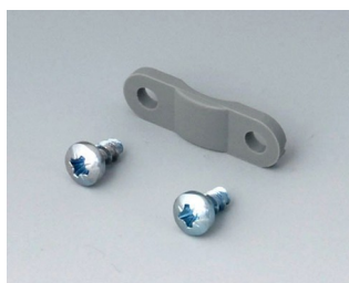
A9199005 Décharge de traction PA 6 volcan