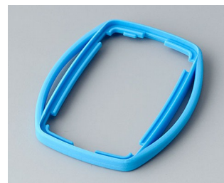
B9002755 Bague intermédiaire ES TPE bleu