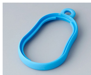
B9002355 Bague intermédiaire DS TPE bleu