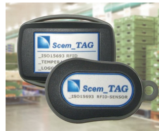
Capteur transpondeur et enregistreur de données RFID