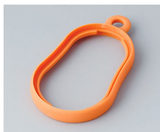
B9002353 Bague intermédiaire DS TPE orange