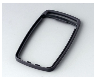
B9004702 Bague intermédiaire EM TPE lava