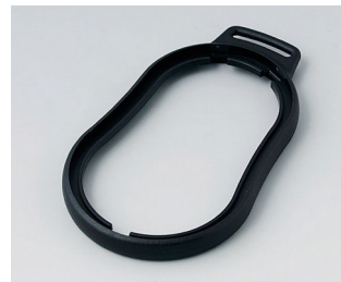
B9006306 Bague intermédiaire DL PMMA (IR) (UL 94 HB) noir RAL 9005