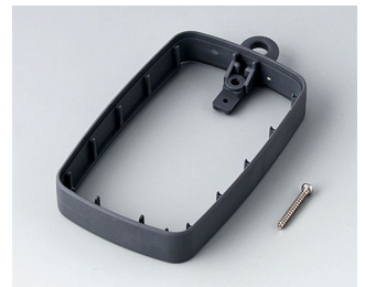
B9004782 Bague intermédiaire EM, surélevé SEBS (TPE) lava