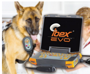
Appareil portable à ultrasons pour la médecine vétérinaire