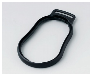
B9004306 Bague intermédiaire DM PMMA (IR) (UL 94 HB) noir RAL 9005