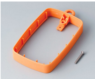
B9004783 Bague intermédiaire EM, surélevé TPE orange