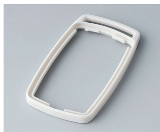
B9002707 Bague intermédiaire ES TPE gris blanc RAL 9002