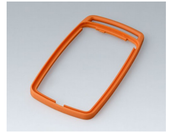
B9006703 Bague intermédiaire EL TPE orange