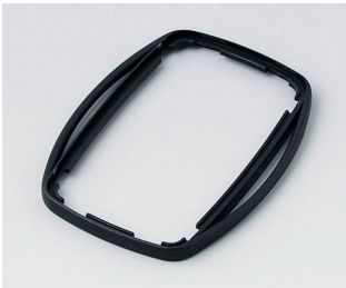
B9004756 Bague intermédiaire EM PMMA (IR) (UL 94 HB) noir RAL 9005