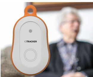
Traceur GPS LoRa avec bouton d'alarme