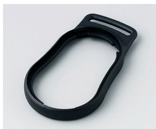
B9002306 Bague intermédiaire DS PMMA (IR) (UL 94 HB) noir RAL 9005