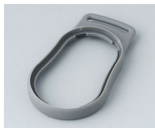
B9002308 Bague intermédiaire DS TPE volcan