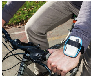
Surveillance mobile de la qualité de l'air