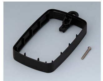
B9004786 Bague intermédiaire EM, surélevé PMMA (IR) (UL 94 HB) noir RAL 9005