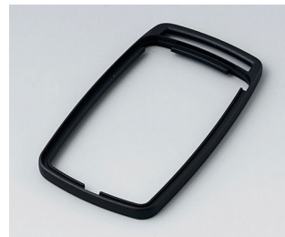
B9006706 Bague intermédiaire EL PMMA (IR) (UL 94 HB) noir RAL 9005