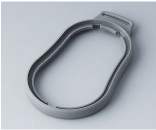
B9006308 Bague intermédiaire DL TPE volcan