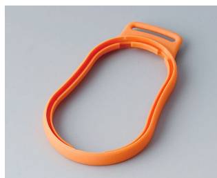
B9004303 Bague intermédiaire DM TPE orange