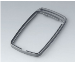
B9006708 Bague intermédiaire EL TPE volcan