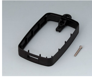
B9004799 Bague intermédiaire EM, type A USB ABS (UL 94 HB) noir RAL 9005