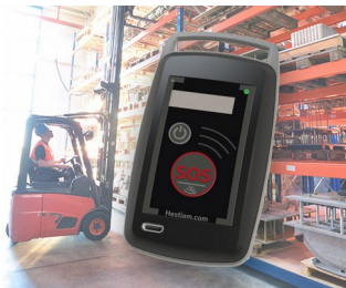
Solution de sécurité portée par le travailleur