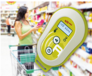
Appareil de lecture mobile UHF-RFID