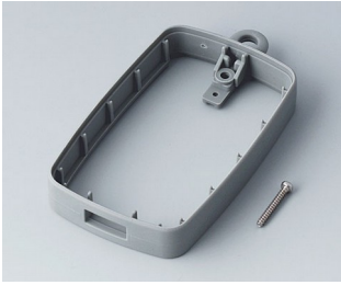
B9004798 Bague intermédiaire EM, type A USB SEBS (TPE) volcan