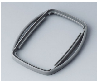
B9006758 Bague intermédiaire EL TPE volcan