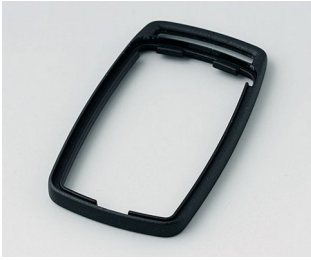
B9002706 Bague intermédiaire ES PMMA (IR) (UL 94 HB) noir RAL 9005