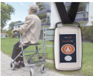
Émetteur radio pour système d'appel d'urgence patient