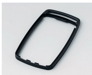
B9004706 Bague intermédiaire EM PMMA (IR) (UL 94 HB) noir RAL 9005