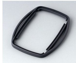
B9006752 Bague intermédiaire EL TPE lava