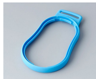
B9004305 Bague intermédiaire DM TPE bleu