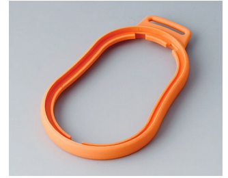
B9006303 Bague intermédiaire DL TPE orange