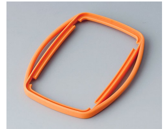
B9006753 Bague intermédiaire EL TPE orange