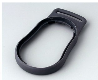
B9002302 Bague intermédiaire DS TPE lava