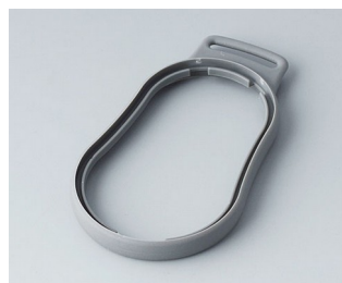
B9004308 Bague intermédiaire DM TPE volcan