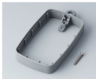
B9004788 Bague intermédiaire EM, surélevé TPE volcan