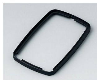
B9006786 Bague intermédiaire EL PMMA (IR) (UL 94 HB) noir RAL 9005