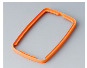
B9006783 Bague intermédiaire EL TPE orange