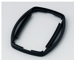
B9002756 Bague intermédiaire ES PMMA (IR) (UL 94 HB) noir RAL 9005