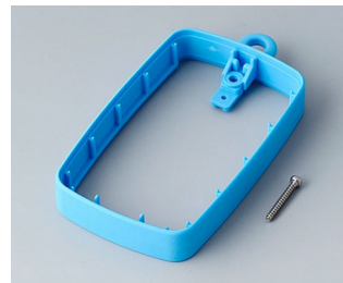
B9004785 Bague intermédiaire EM, surélevé TPE bleu