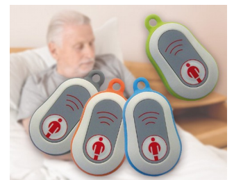
Émetteur d'appel radio en médaillon