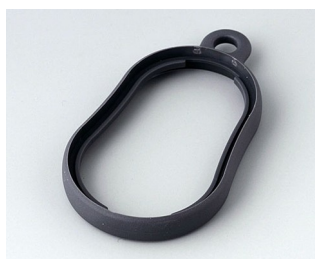
B9002352 Bague intermédiaire DS TPE lava