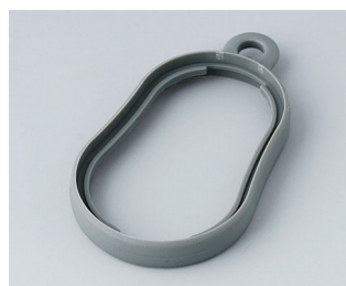
B9002358 Bague intermédiaire DS TPE volcan