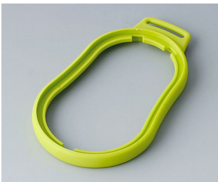
B9006304 Bague intermédiaire DL TPE vert