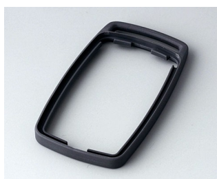
B9002702 Bague intermédiaire ES TPE lava