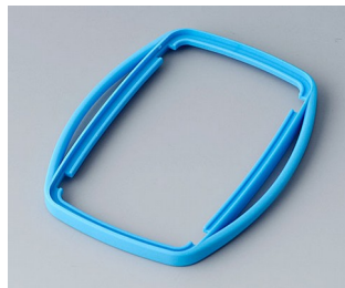
B9006755 Bague intermédiaire EL TPE bleu