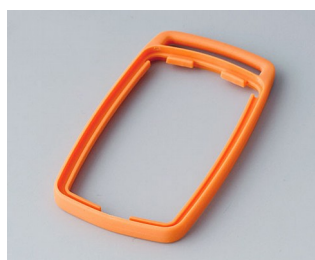
B9002703 Bague intermédiaire ES TPE orange