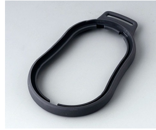
B9006302 Bague intermédiaire DL TPE lava