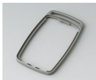
B9004708 Bague intermédiaire EM TPE volcan