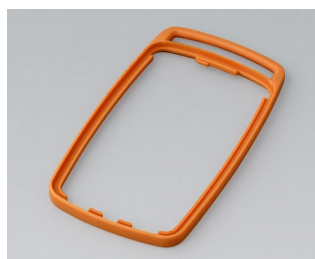
B9004703 Bague intermédiaire EM TPE orange