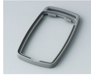
B9002708 Bague intermédiaire ES TPE volcan