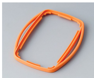
B9004753 Bague intermédiaire EM SEBS (TPE) orange