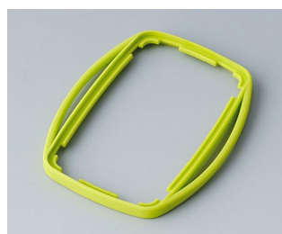
B9004754 Bague intermédiaire EM TPE vert