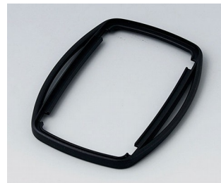
B9006756 Bague intermédiaire EL PMMA (IR) (UL 94 HB) noir RAL 9005