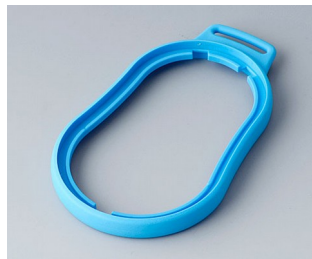
B9006305 Bague intermédiaire DL TPE bleu