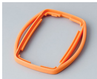
B9002753 Bague intermédiaire ES TPE orange