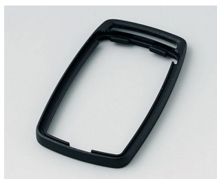
B9002706 Bague intermédiaire ES PMMA (IR) (UL 94 HB) noir RAL 9005