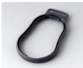
B9004302 Bague intermédiaire DM TPE lava