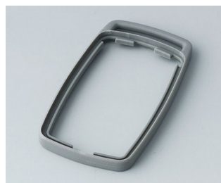
B9002708 Bague intermédiaire ES TPE volcan