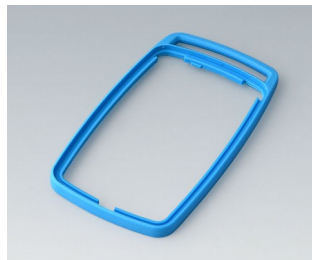
B9006705 Bague intermédiaire EL TPE bleu