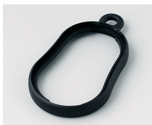
B9002356 Bague intermédiaire DS PMMA (IR) (UL 94 HB) noir RAL 9005