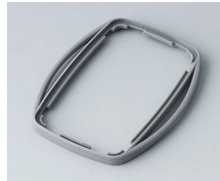
B9004758 Bague intermédiaire EM TPE volcan