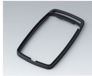
B9006702 Bague intermédiaire EL TPE lava