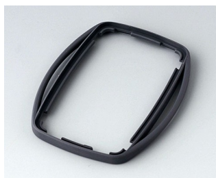
B9004752 Bague intermédiaire EM TPE lava