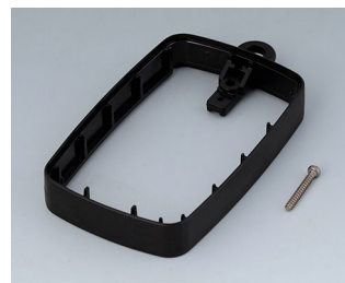
B9004789 Bague intermédiaire EM, surélevé ABS (UL 94 HB) noir RAL 9005