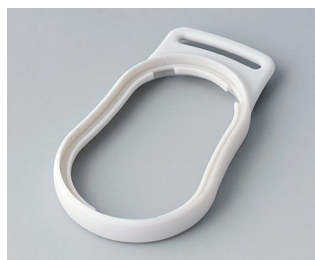
B9002307 Bague intermédiaire DS SEBS (TPE) gris blanc RAL 9002