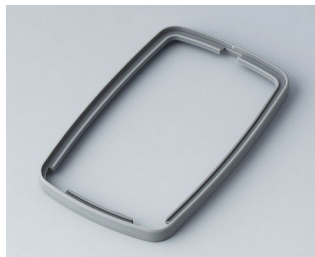
B9006788 Bague intermédiaire EL TPE volcan