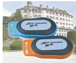
Système d'information RFID mobile