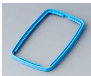
B9006785 Bague intermédiaire EL TPE bleu