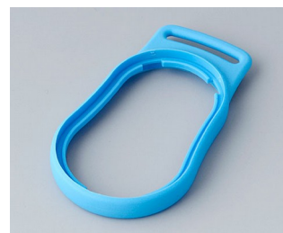
B9002305 Bague intermédiaire DS TPE bleu