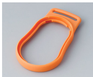
B9002303 Bague intermédiaire DS SEBS (TPE) orange