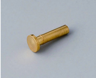
A9193030 Broche de contact doré