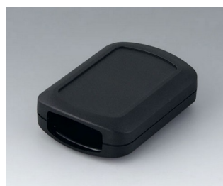
B2832109 CONNECT M ASA+PC (UL 94 V-0) noir RAL 9005 76x54x22mm