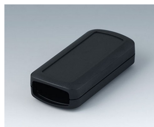
B2823109 CONNECT S ASA+PC (UL 94 V-0) noir RAL 9005 90x42x22mm