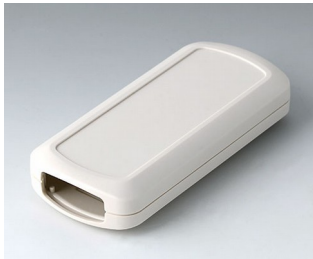
B2833107 CONNECT M ASA+PC (UL 94 V-0) gris blanc RAL 9002 116x54x22mm