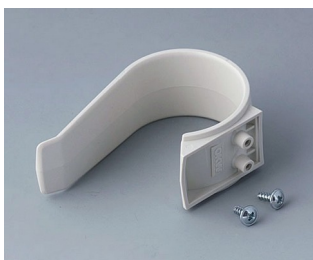
A9167027 Étrier de retenue PA 6 (UL 94 HB) gris blanc RAL 9002