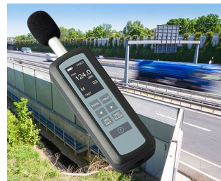
Mesure du niveau de bruit