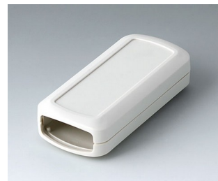
B2823107 CONNECT S ASA+PC (UL 94 V-0) gris blanc RAL 9002 90x42x22mm