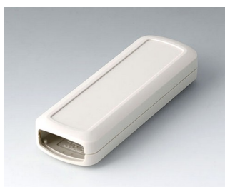
B2824107 CONNECT S ASA+PC (UL 94 V-0) gris blanc RAL 9002 120x42x22mm