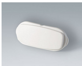
B2811207 Élément d'extrémité ASA+PC (UL 94 V-0) gris blanc RAL 9002