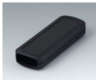
B2824109 CONNECT S ASA+PC (UL 94 V-0) noir RAL 9005 120x42x22mm