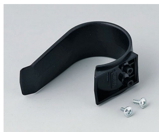
A9167029 Étrier de retenue PA 6 (UL 94 HB) noir RAL 9005