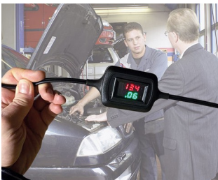
Affichage de la tension et du courant en mode maintien de charge