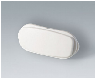
B2811207 Élément d'extrémité ASA+PC (UL 94 V-0) gris blanc RAL 9002