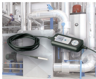
Surveillance de processus avec capteur de température