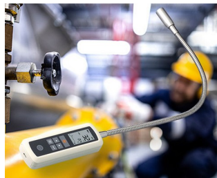
Détecteur de fuite de gaz