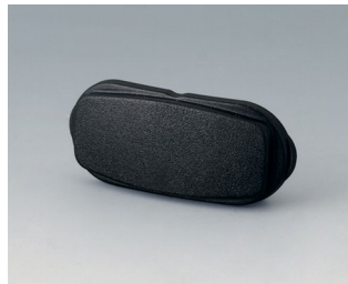
B2811209 Élément d'extrémité ASA+PC (UL 94 V-0) noir RAL 9005