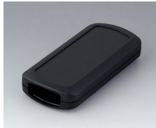
B2833109 CONNECT M ASA+PC (UL 94 V-0) noir RAL 9005 116x54x22mm