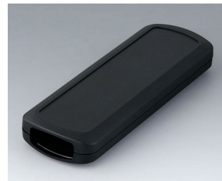
B2834109 CONNECT M ASA+PC (UL 94 V-0) noir RAL 9005 156x54x22mm