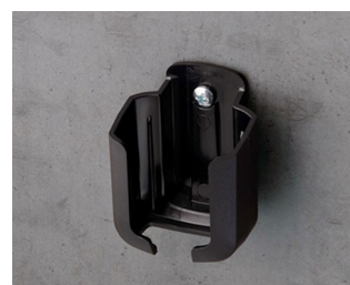
B2921509 Support S ASA+PC (UL 94 V-0) noir RAL 9005