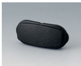
B2811209 Élément d'extrémité ASA+PC (UL 94 V-0) noir RAL 9005