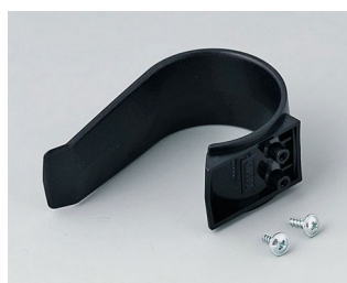
A9167029 Étrier de retenue PA 6 (UL 94 HB) noir RAL 9005