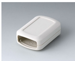
B2822107 CONNECT S ASA+PC (UL 94 V-0) gris blanc RAL 9002 60x42x22mm