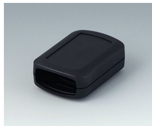
B2822109 CONNECT S ASA+PC (UL 94 V-0) noir RAL 9005 60x42x22mm