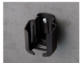
B2921509 Support S ASA+PC (UL 94 V-0) noir RAL 9005