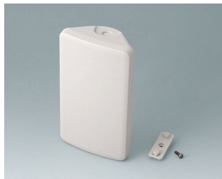
B4608107 SMART-CONTROL S, Vers. I ASA+PC (UL 94 V-0) gris blanc RAL 9002 142x81x46mm IP 55 opt., IP 40