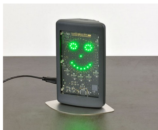
Appareil de mesure de l'air intérieur