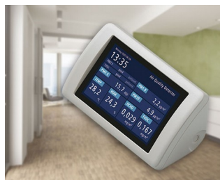
Appareil de mesure des aérosols