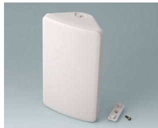
B4610107 SMART-CONTROL M, Vers. I ASA+PC (UL 94 V-0) gris blanc RAL 9002 173x101x59mm IP 55 opt., IP 40