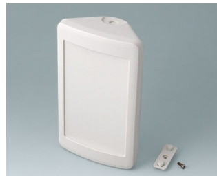
B4610207 SMART-CONTROL M, Vers. II ASA+PC (UL 94 V-0) gris blanc RAL 9002 173x101x59mm IP 55 opt., IP 40