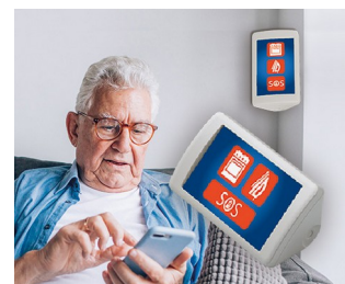
Système d'assistance AAL