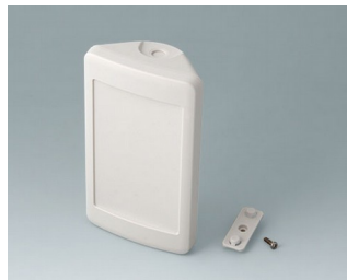
B4608207 SMART-CONTROL S, Vers. II ASA+PC (UL 94 V-0) gris blanc RAL 9002 142x81x46mm IP 55 opt., IP 40