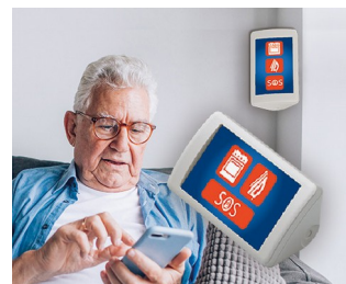
Système d'assistance AAL