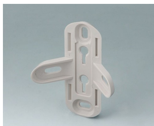
B4705907 Support mural ASA+PC (UL 94 V-0)