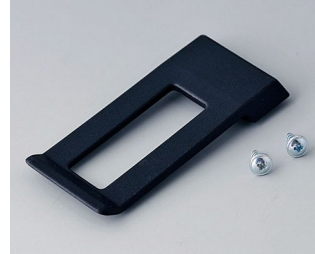
A9172109 Clip de poche ABS (UL 94 HB) noir RAL 9005 62x30mm