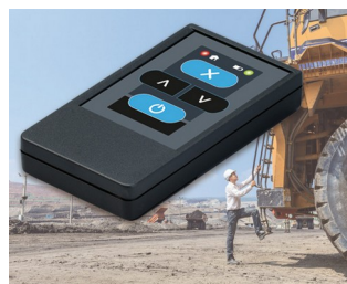
Émetteur radio pour machines