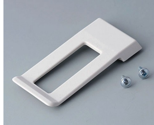
A9172107 Clip de poche ABS (UL 94 HB) gris blanc RAL 9002 62x30mm