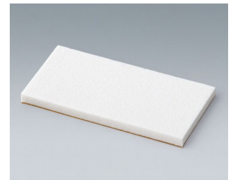
A9250251 Pièce de maintien PE cellulaire 50x25x3mm