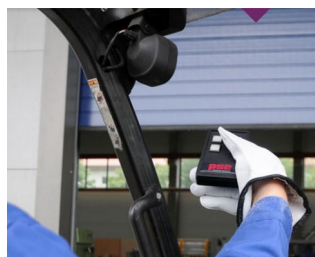
Télécommande IR pour environnements rudes