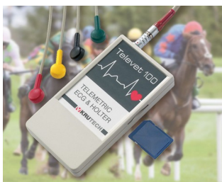
Système téléométrique ECG pour la médecine vétérinaire