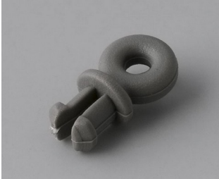
A9100001 Anneau PA 6 volcan