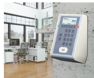
Terminal de badgeage