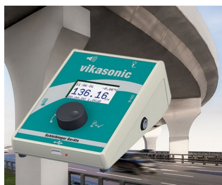
Appareil de mesure à ultrasons