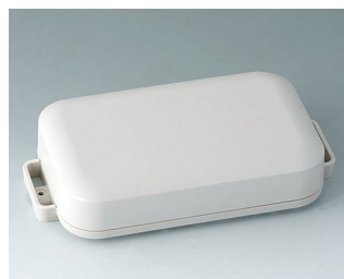
C3208107 EASYTEC 150 ASA+PC (UL 94 V-0) gris blanc RAL 9002 172x93x36mm IP 65 opt., IP 40