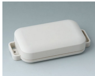
C3206107 EASYTEC 100 ASA+PC (UL 94 V-0) gris blanc RAL 9002 121x62x26mm IP 65 opt., IP 40