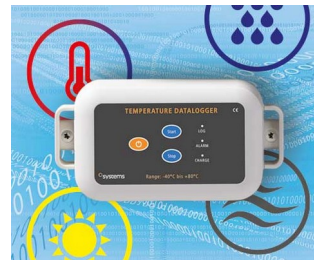
Enregistreur de données par ex. température