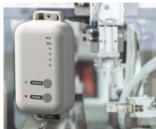
Enregistreur de données avec fonction de passerelle