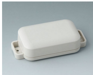
C3204207 EASYTEC 80 ASA+PC (UL 94 V-0) gris blanc RAL 9002 101x50x26mm IP 65 opt., IP 40