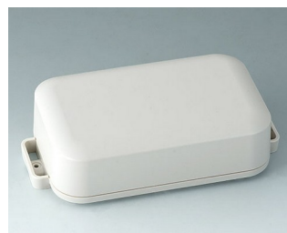
C3208207 EASYTEC 150 ASA+PC (UL 94 V-0) gris blanc RAL 9002 172x93x46mm IP 65 opt., IP 40