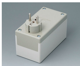
A9021665 BOITIER PRISE F / D, Vers. I PC+ABS (UL 94 V-0) gris silex RAL 7032 120x65x65mm