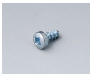
A0306031 Vis autotaraudeuses 3 x 6 mm (PZ1)