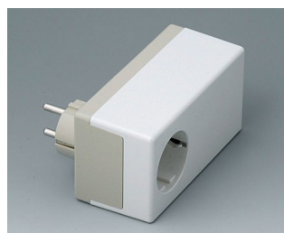
A9022465 BOITIER PRISE D, Vers. II PC+ABS (UL 94 V-0) gris silex RAL 7032 120x65x55mm