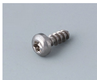
A0308132 Vis autotaraudeuse 3 x 8 mm (T10) Acier inoxydable

Sous réserve de modifications techniques. © OKW Gehäusesysteme, Buchen/Allemagne.