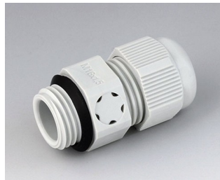
C2316917 Passe-câble à vis M16x1,5, compensation de pression PA gris clair RAL 7035