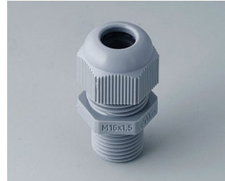
C2316618 Passe câble à vis M16x1,5 PA gris argent RAL 7001