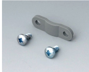
A9199005 Décharge de traction PA 6 volcan