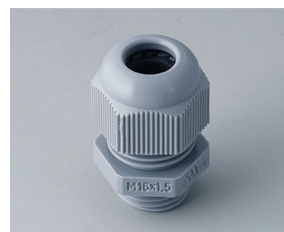
C2316418 Passe-câble à vis M16x1,5 PA gris argent RAL 7001