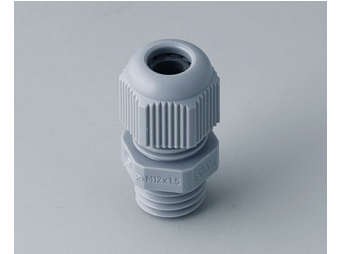
C2312418 Passe-câble à vis M12x1,5 PA gris argent RAL 7001