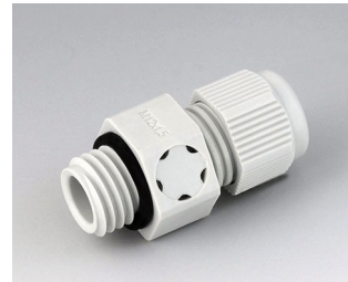
C2312917 Passe-câble à vis M12x1,5, compensation de pression PA gris clair RAL 7035