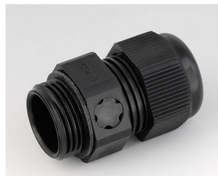
C2320919 Passe-câble à vis M20x1,5, compensation de pression PA noir RAL 9005 IP 68