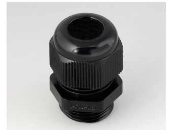
C2320419 Passe-câble à vis M20x1,5 PA noir RAL 9005