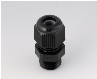
C2312419 Passe-câble à vis M12x1,5 PA noir RAL 9005