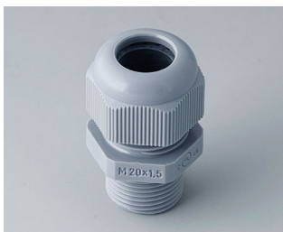
C2320428 Passe-câble à vis M20x1,5 PA gris argent RAL 7001