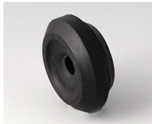
C2320159 Passe-câble TPE (UL 94 V-0) noir RAL 9005