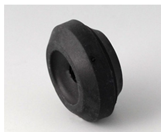
C2316159 Passe-câble TPE (UL 94 V-0) noir RAL 9005