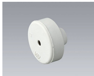
C2312137 Passe-câble EPDM gris clair RAL 7035