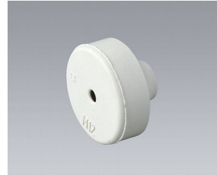
C2312137 Passe-câble EPDM gris clair RAL 7035