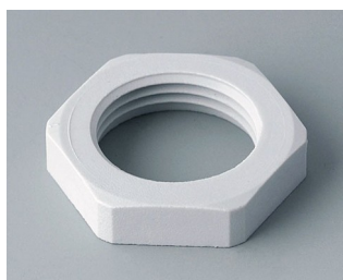
C2320117 Contre-écrou M20x1,5 PA gris clair RAL 7035