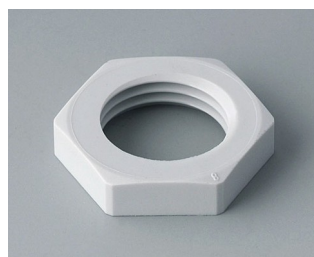
C2316117 Contre-écrou M16x1,5 PA gris clair RAL 7035