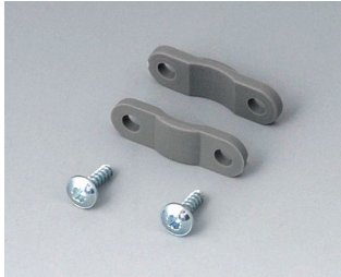
A9166004 Jeu de décharge de traction PA 6 volcan