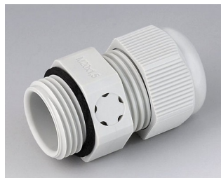
C2320917 Passe-câble à vis M20x1,5, compensation de pression PA gris clair RAL 7035 IP 68