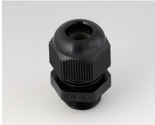
C2316419 Passe-câble à vis M16x1,5 PA noir RAL 9005