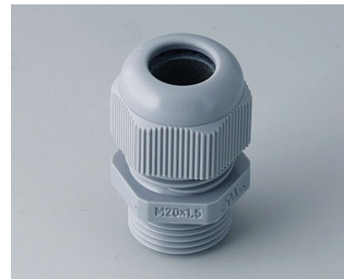
C2320418 Passe-câble à vis M20x1,5 PA gris argent RAL 7001