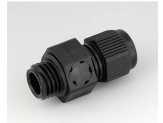
C2312919 Passe-câble à vis M12x1,5, compensation de pression PA noir RAL 9005