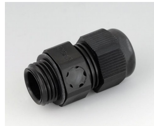
C2316919 Passe-câble à vis M16x1,5, compensation de pression PA noir RAL 9005