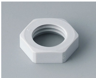
C2312117 Contre-écrou M12x1,5 PA gris clair RAL 7035