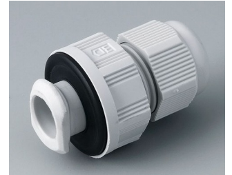
C2316717 Passe-câble à vis, M16, quick fix PA gris clair RAL 7035