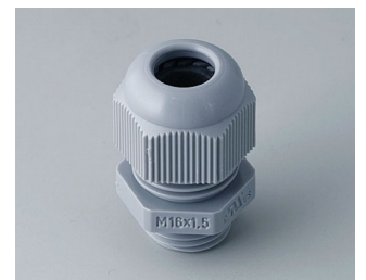
C2316418 Passe-câble à vis M16x1,5 PA gris argent RAL 7001