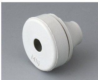
C2316137 Passe-câble EPDM gris clair RAL 7035