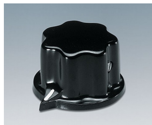
A1321060 BOUTON, à fixation latérale par vis PF noir RAL 9005 31x20mm 6mm