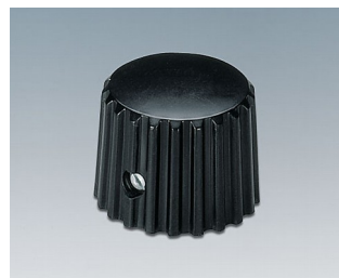
A1321160 BOUTON, à fixation latérale par vis ABS (UL 94 HB) noir RAL 9005 20x16mm 6mm